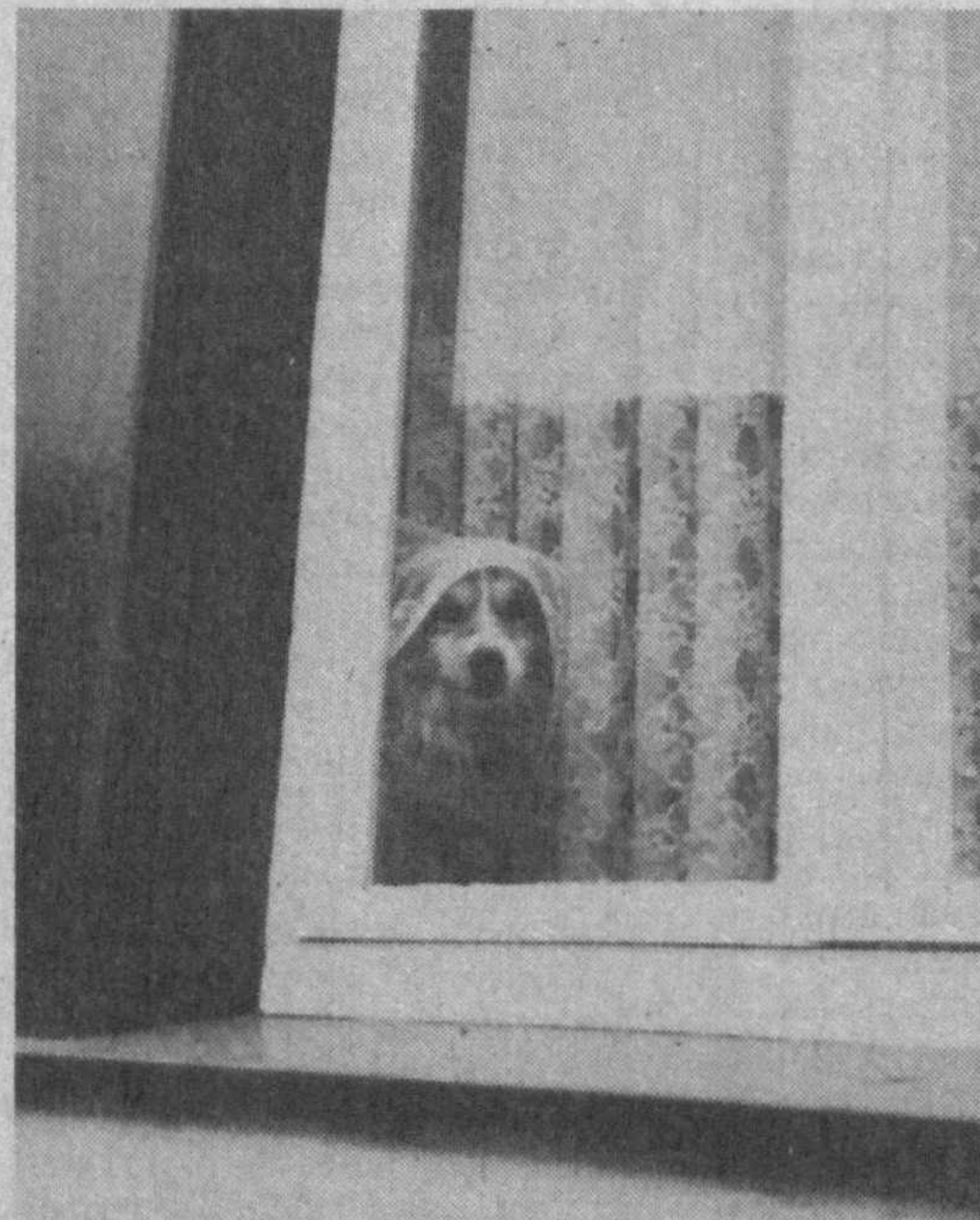
НА СНИМКЕ: на фотография-любителя, снимающего кадры на память о поездке и бродяжке в поисках самого интересного ракурса, из окошка с любовью смотрит явно не мифическое существо, и тем не менее почему-то кажется, что уже слышишь загадочный вопрос: — А разве я не красавица?!