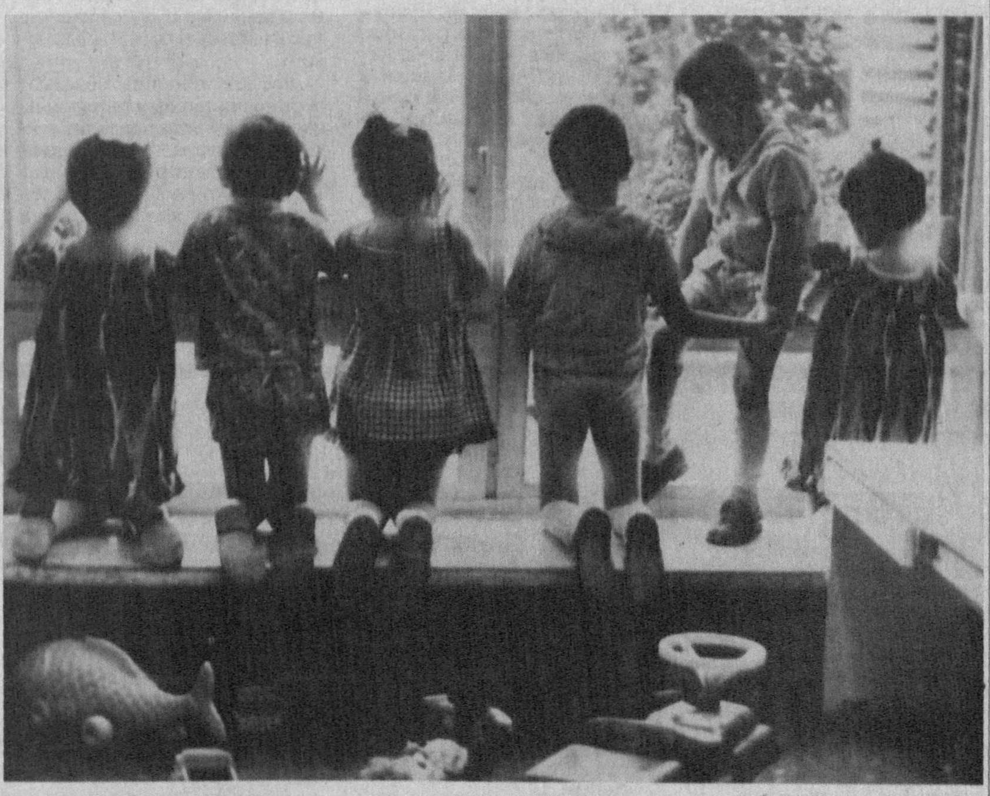
В ожидании родителей.

Клеювую краску улаживают кистей и валиком просто водой. Просушивают, ставя в банку сешной вверх.