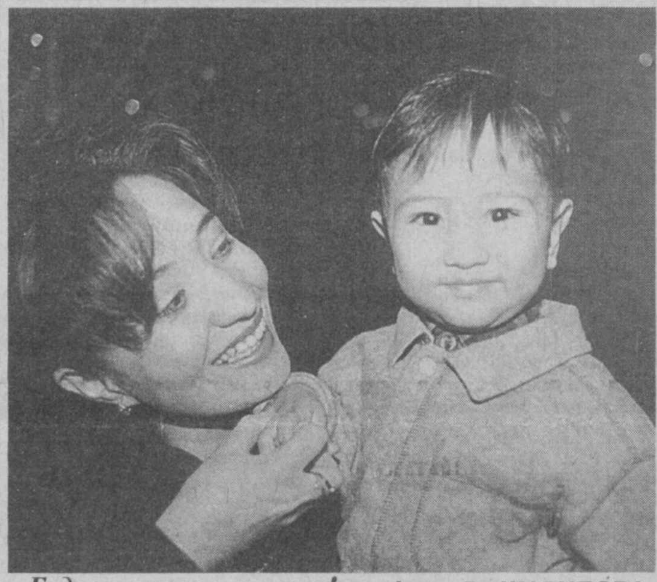
Будь счастлива, малыш!

В этом возрасте ребята довольно часто уходят и в криминальную сферу. Именно поэтому наша организация ставит перед собой задачу — увести подростков с улицы, дав