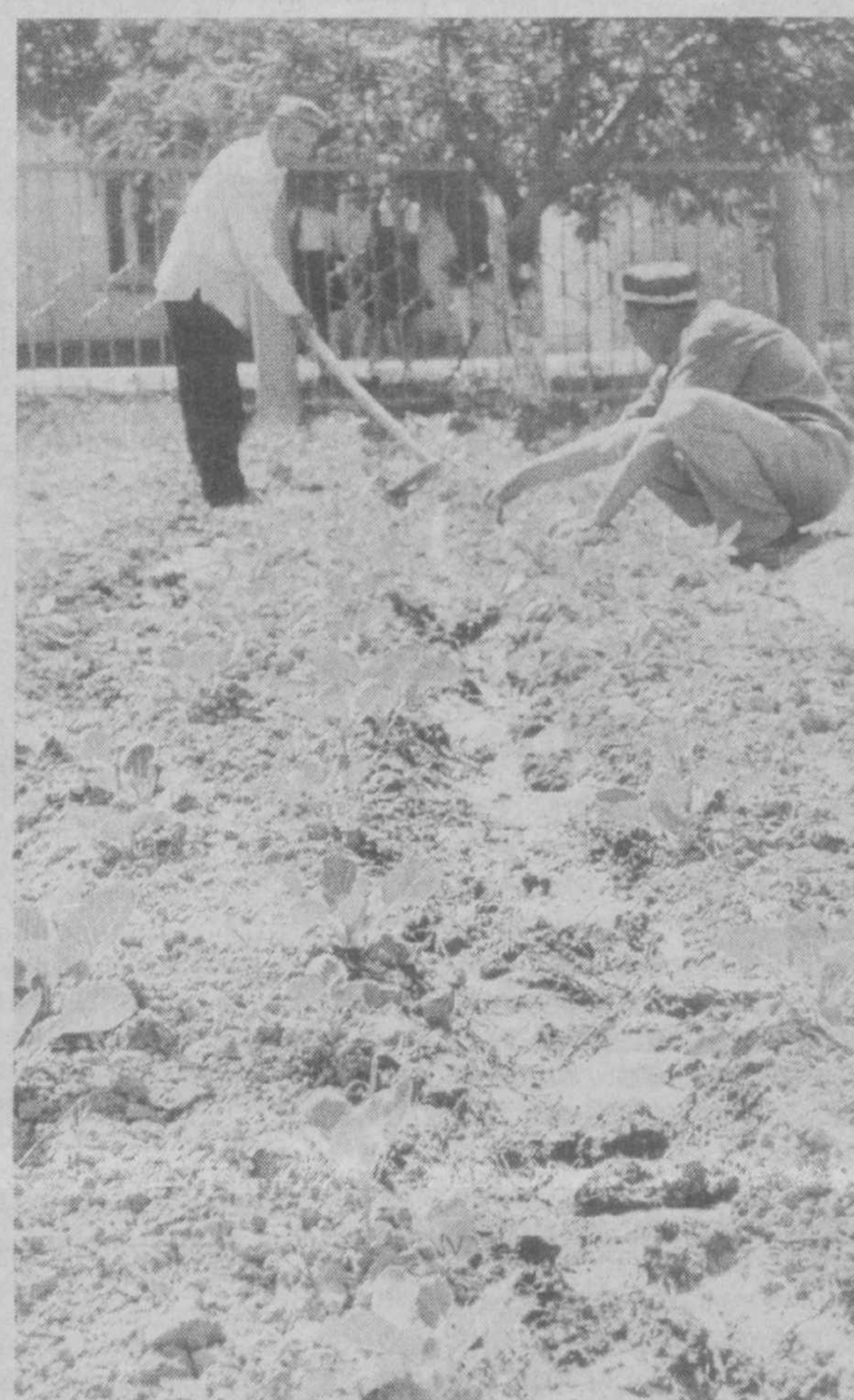
Земля требует постоянной заботы.

А наш читатель В.Васильев разводит божьих коровок в банке, на дно которой укладывает листья, веточки, заселяет туда жучков, сверху прикрывает банку марлей. Результат — отличный!