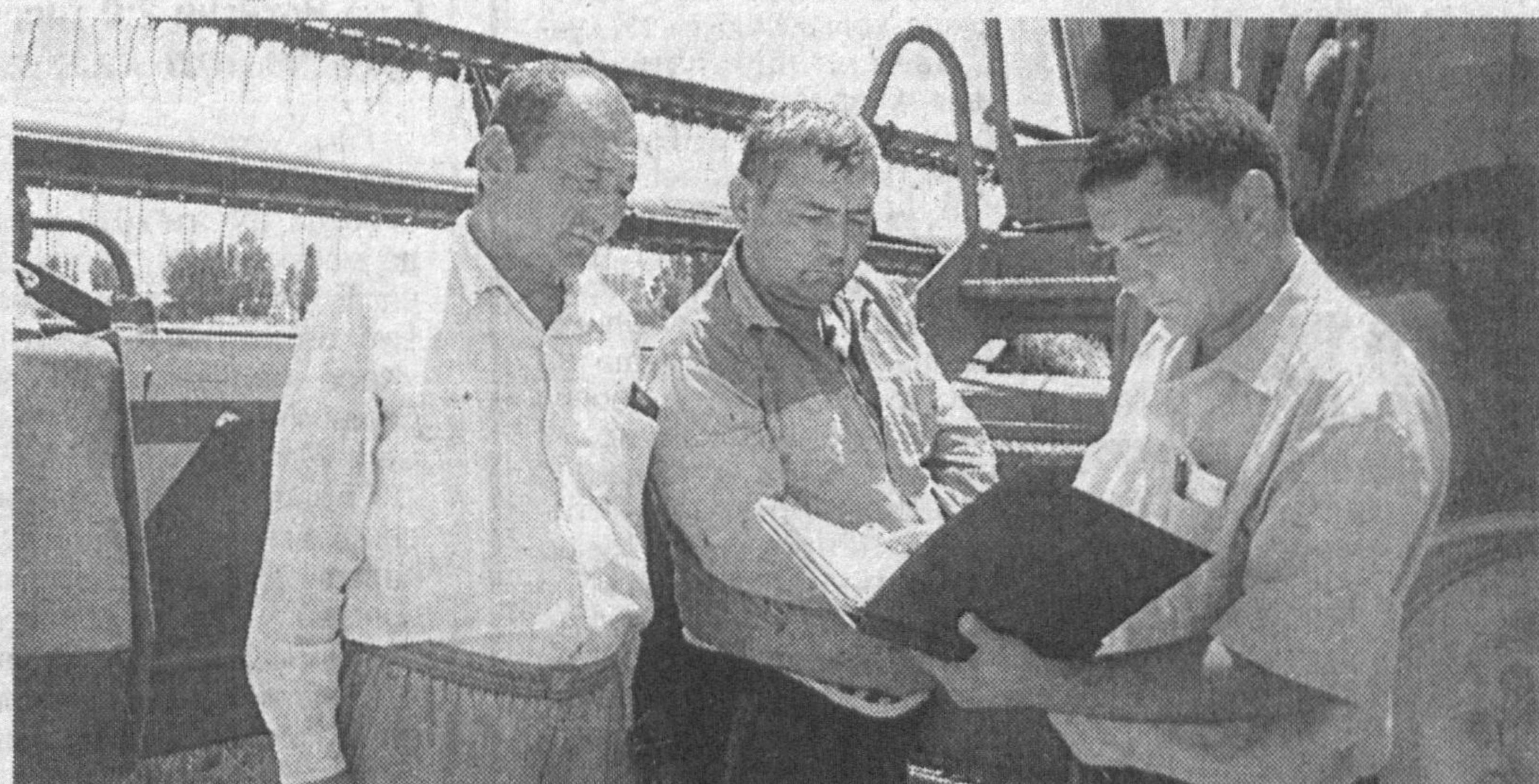
ҳаракати билан боғлиқ.

Бироқ, ширкат хўжаликчлари кай даражада барқарор иш юритмасин, қанчалик иқтисодий бақувват бўлмасин, барибир, қишлоқ хўжалигининг келяжак тақдири фермерлик