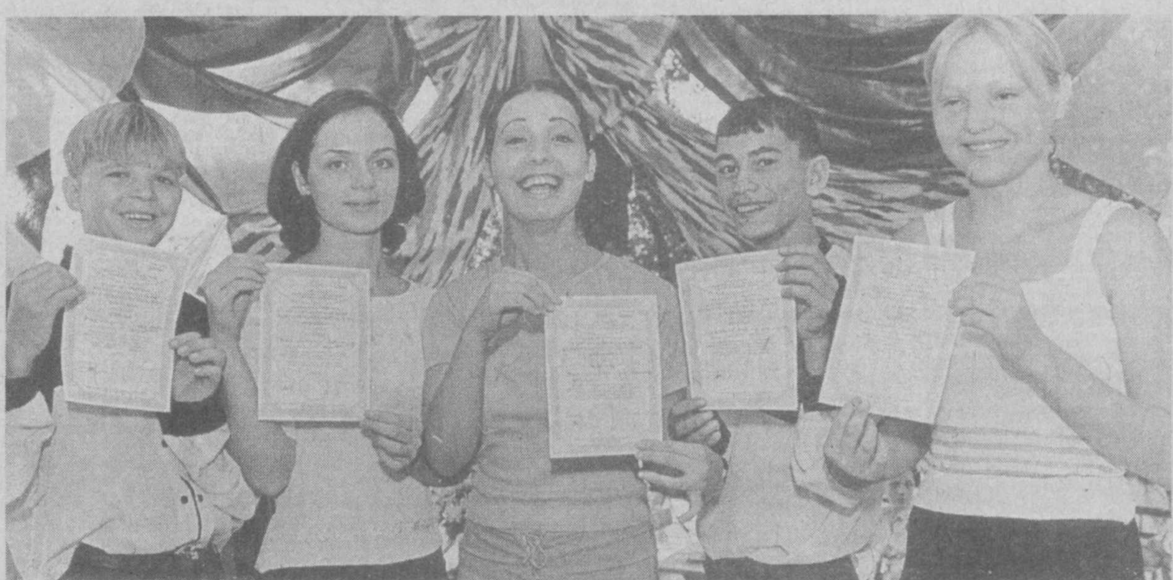
Соб. инф. НА СНИМКЕ: эти акции помогут ребятам в дальнейшей жизни.

ВЧЕРА на центральной стадионе «Пахтакор» состоялся матч второго отборочного этапа чемпионата мира. В группе «В» встречались команды сборной Узбекистана и Катара. После поражения в первом туре в ОАЭ узбекистанцев на своем поле устраивала только победа. И они ее добились. В первом тайме после розыгрыша углового в сутолоке у ворот Джафару Ирismetову удалось протолкнуть мяч «в раму». Хозяева повели 1:0. Этот счет продержался до перерыва. Во второй половине встречи гости недалеко от своей штрафной площадки невежливо обошлись с Максимом Шацких, за что судья назначил штрафной. К мячу, как обычно, подошел Мирджалол Касымов. Катарцы выставили «стенку», но она не помогла. Игрок сборной Узбекистана своей коронной левой ловко переправил мяч в сетку — 2:0. В конце матча сборная Катара прибавила активности и сумела сократить разрыв в счете. В итоге узбекистанцы одержали первую победу во втором этапе. Во втором матче группы «В» сборная Китая обыграла сборную ОАЭ с перевесом 3:0. Результаты матчей в группе «А» таковы: Иран — Саудовская Аравия — 2:0, Бахрейн — Ирак — 2:0.