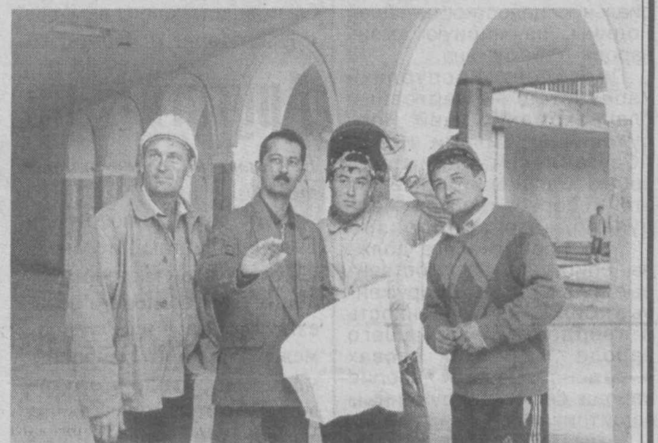
Работники на объекте строительства.