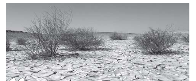
Проблема засухи и опустынивания наносит социальный и экономический ущерб всему человечеству и создает глобальную экологическую угрозу, поэтому находится в центре внимания всего международного сообщества, земледельцев, научных кругов и политологов.

Участники обсудили состояние реализации мер, принятых Узбекистаном в соответствии с обязательствами Конвенции, ответственным за выполнение которых назначен Государственный комитет лесного хозяйства. В соответствии с международным правом дальнейшее совершенствование системы охраны окружающей среды, в частности, защита и рациональное использование земельных ресурсов, признано приоритетной задачей государства. В стране создана законодательная база в этой области. С целью повышения эффективности борьбы с опустыниванием и засухой Президентом страны принято постановление «О мерах по повышению эффективности работ по борьбе с опустыниванием и засухой в Республике Узбекистан».