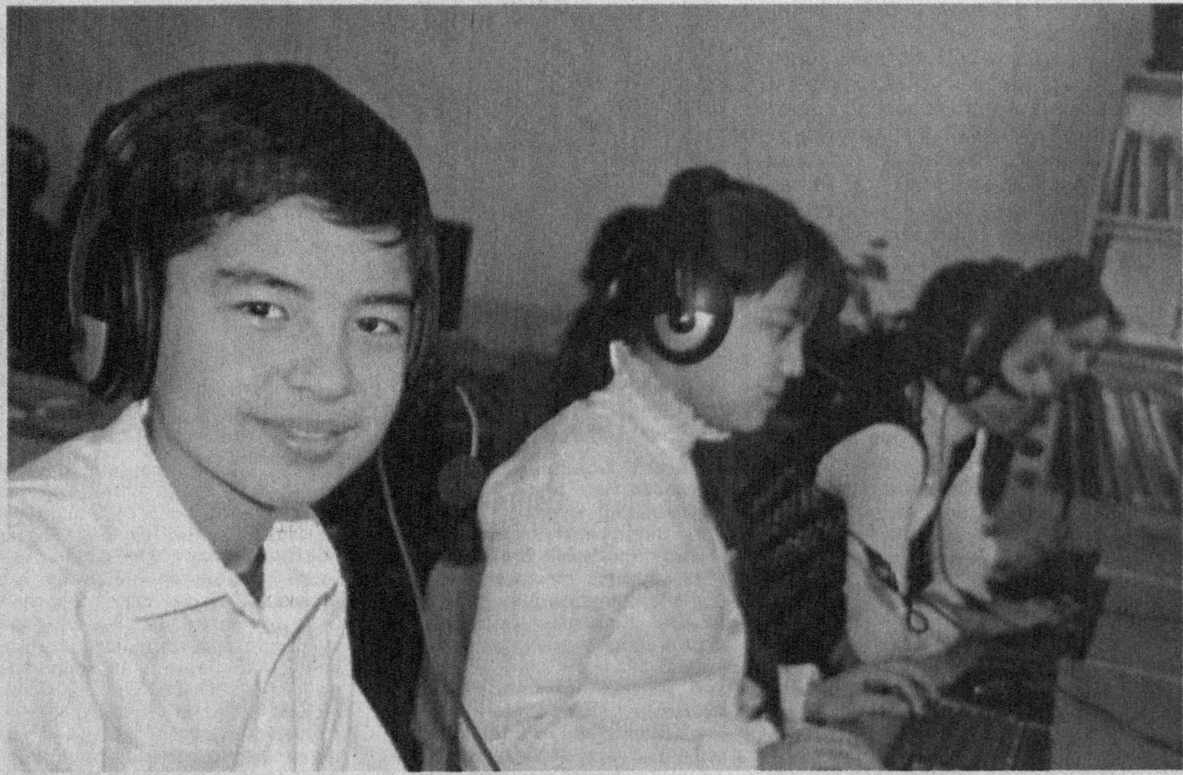
(Давоми. Бошланиш биринчи бетда)

«Тарихий хотирасиз келажак йўқ» деган ҳақиқатга амал қилиб, Кармандаги Қосим Шайх ва Нуросадаги «Чашма» ёдгорлик мажмуалари, Кармана шаҳри ва Работи Малик обидасининг тарихий қиёфаси қайта тикланди. Хотира майдони, Алишер Навоий меъморий мажмуаси ва Навоий шаҳрида Жомеъ масжиди, 2400 ўринга мўлжалланган «Амфитеатр», «Ақвапар» бунёд этилганлиги эса меҳнаткаш ҳалқимизнинг оқибат ва обод Ватан барпо этиш йўлидаги орзу-интилизлари самарасидир.