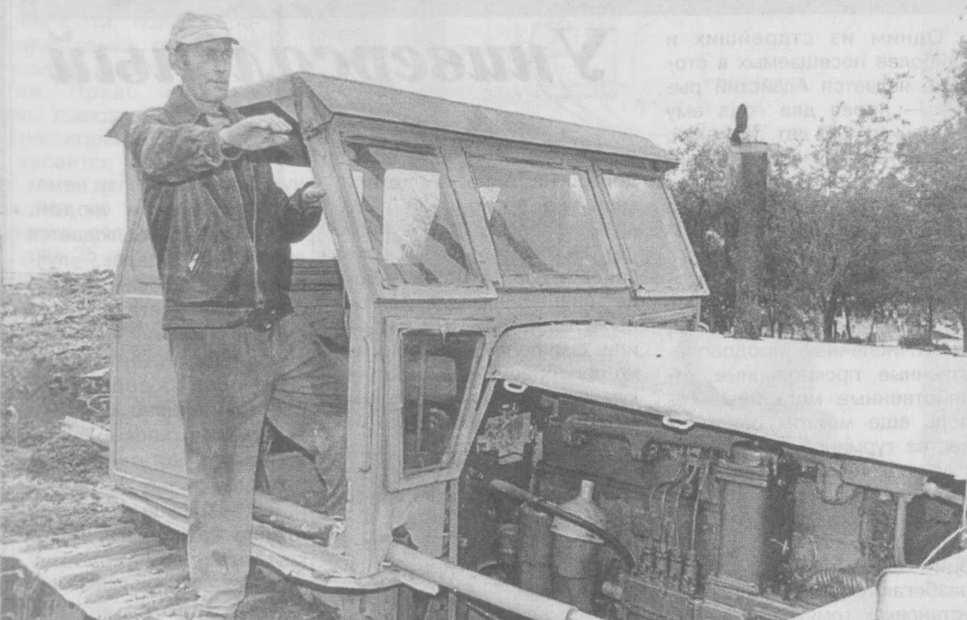
На строительных площадках