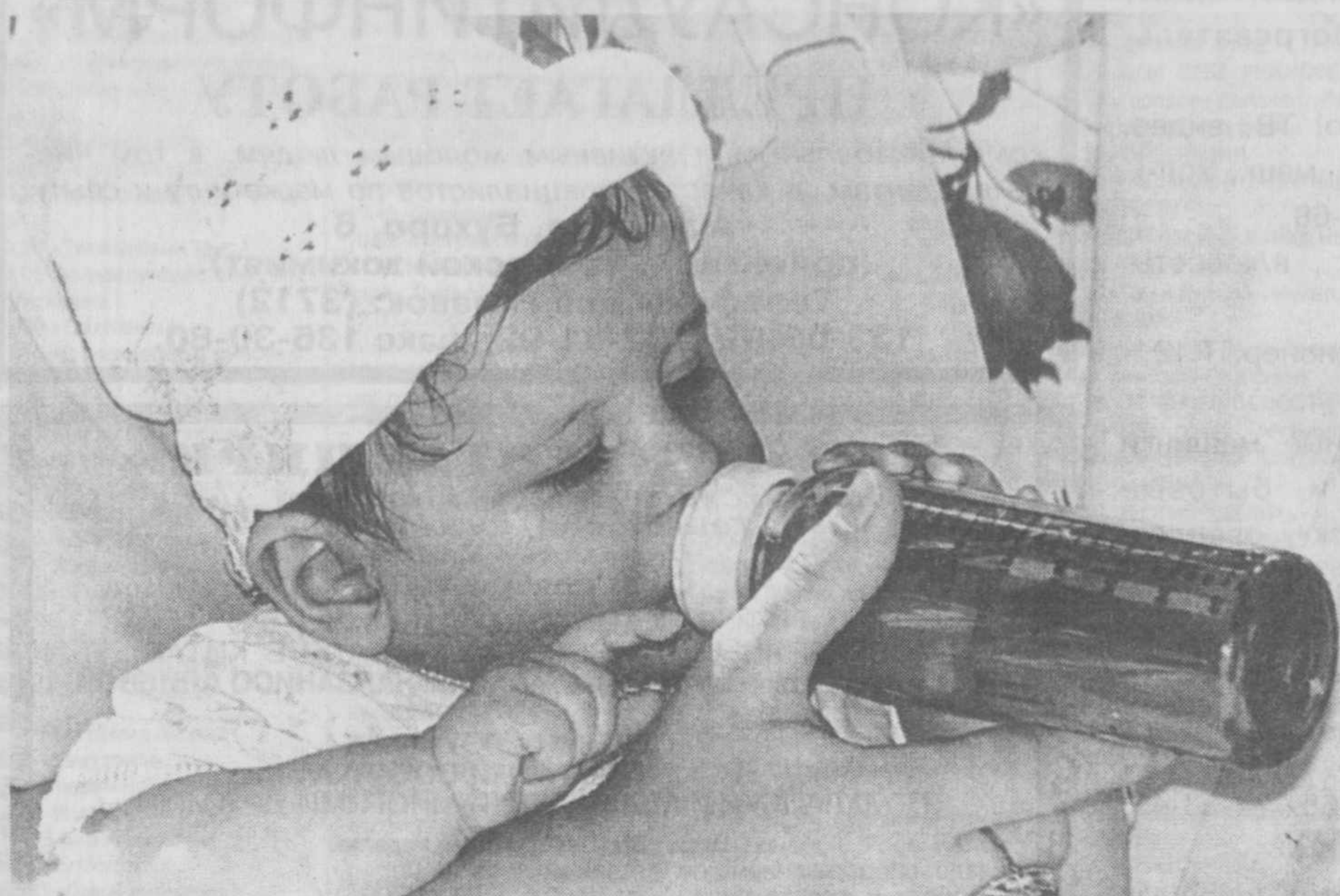
«Не дай себе засохнуть!»