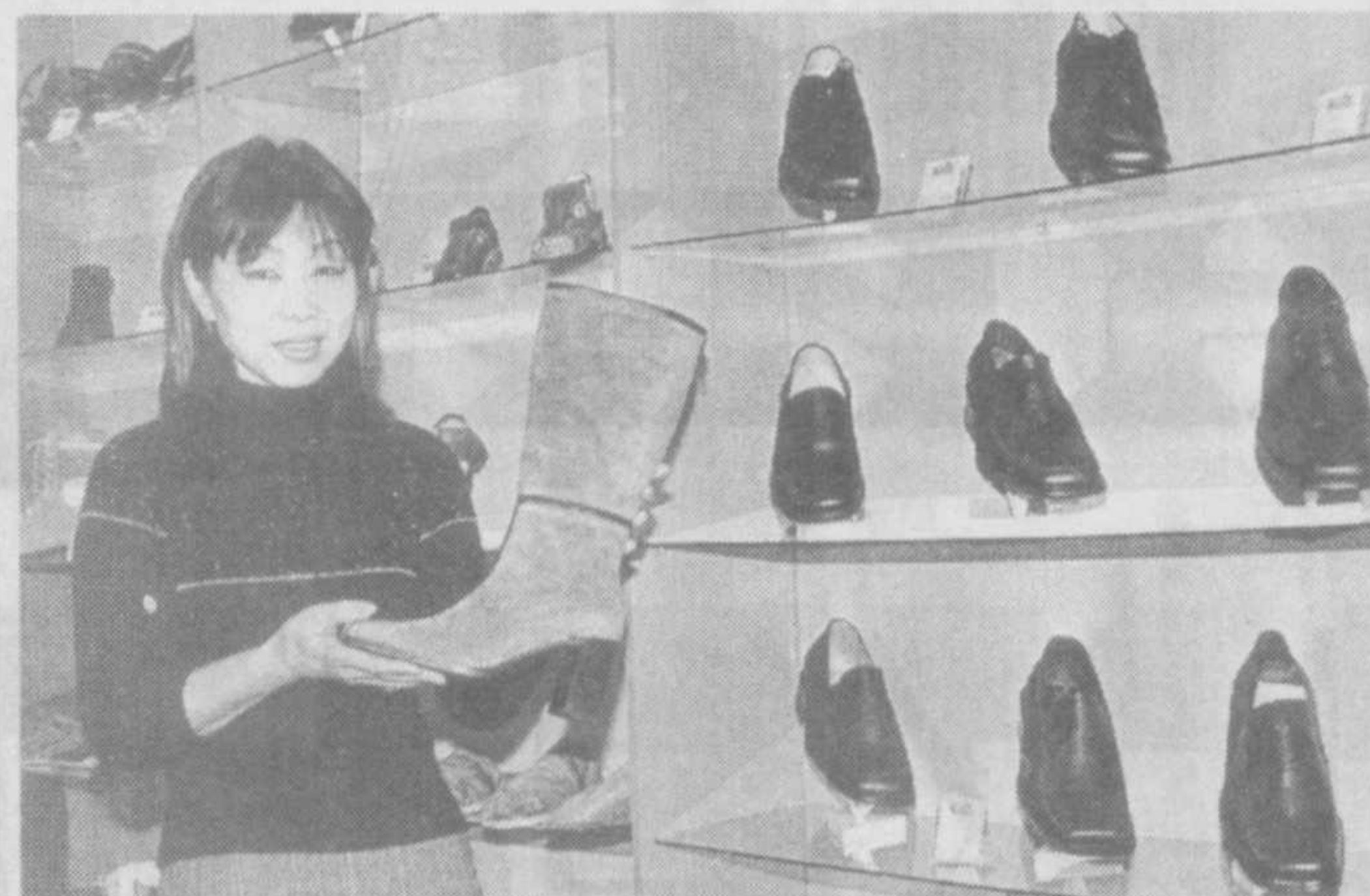
На мировой уровень

Приватизация какой-то части детских садов, безусловно, благо. И хорошо, если наряду с государственной сетью дошкольных учреждений будет развиваться и частная. Но было бы еще лучше, если бы средства, полученные от приватизации детских садов, шли на улучшение содержания государственных дошкольных учреждений. От этого выиграли бы все мы.