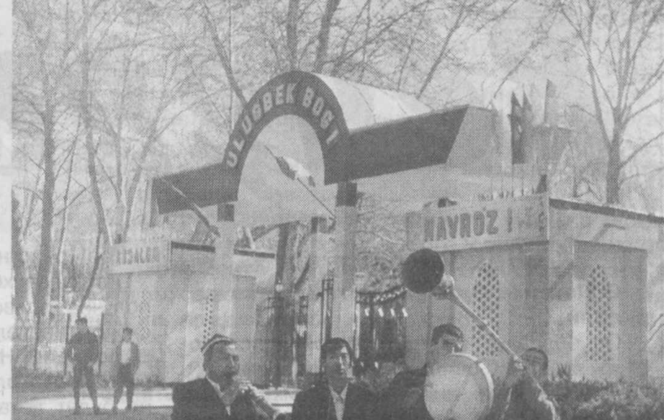
Город и горожане