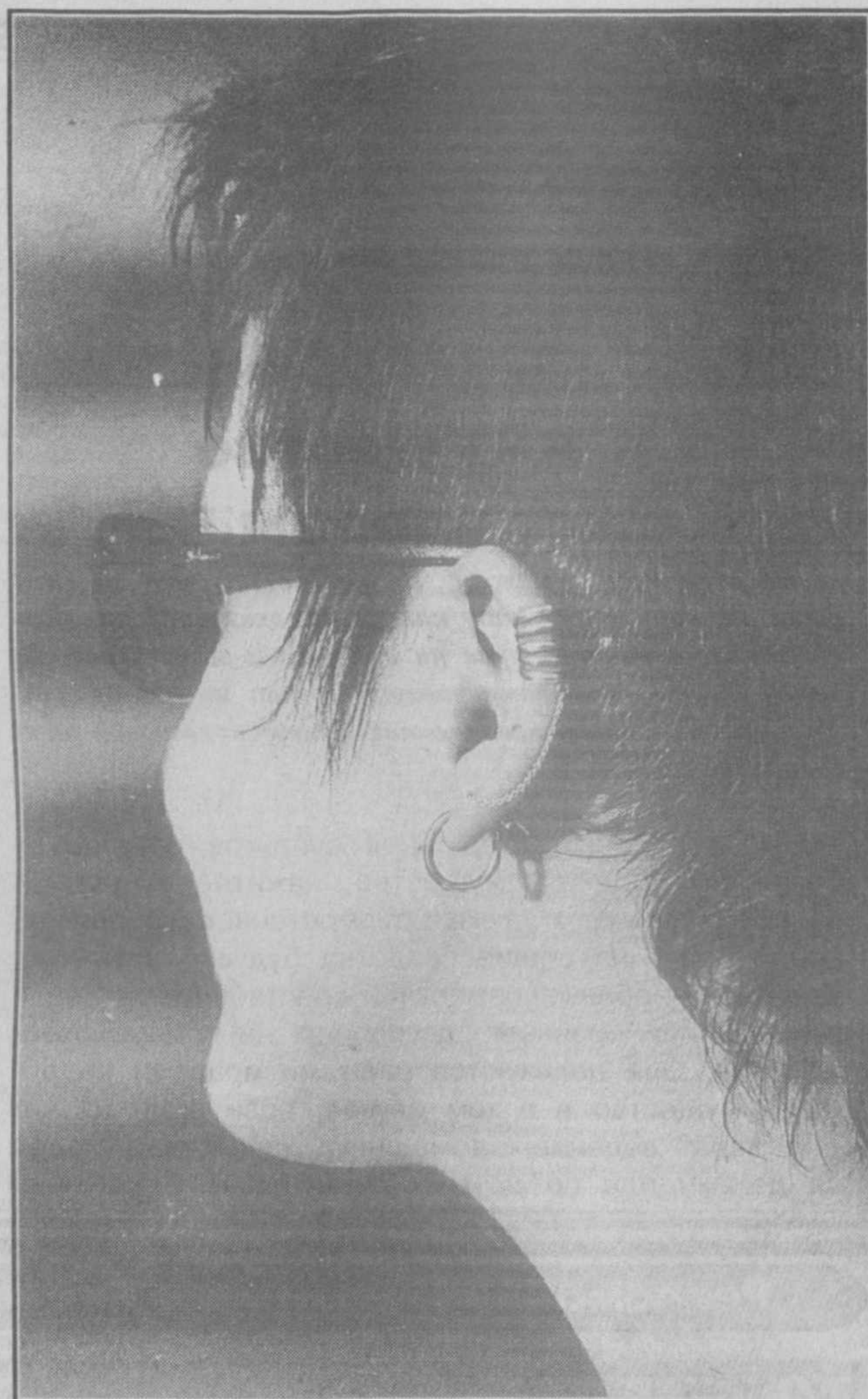
Окольцована, околдована...