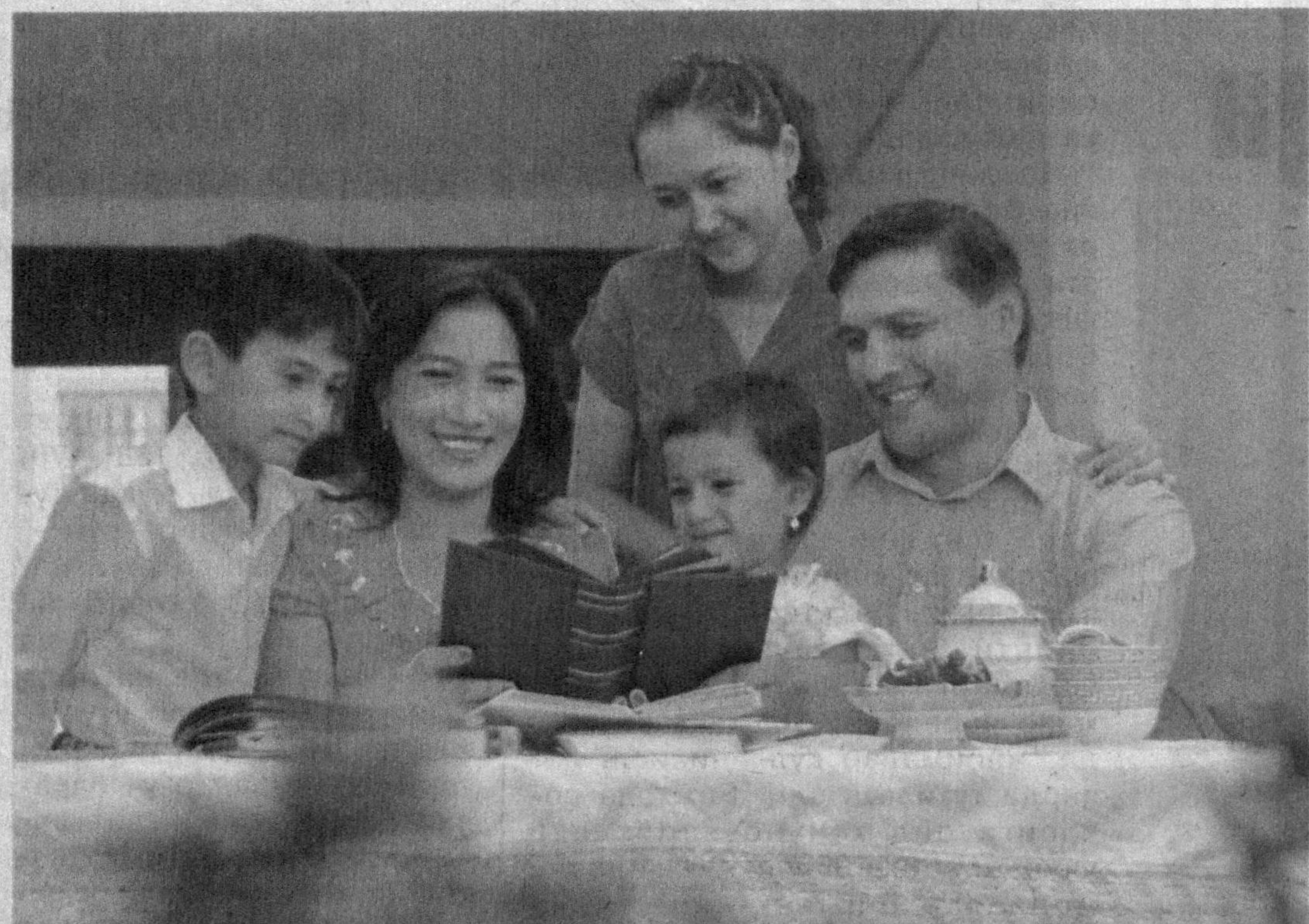
(Давоми. Бошланиш биринчи бетда)

Шунингдек, унда никоҳ томонларнинг ихтиёрли розилиги ва тенг ҳуқуқчилигига асосланиши, ота-оналар ўз фарзандларини вояга етгунларига қадар боқиш ва тарбиялаш, ўз навбатида, вояга етган, меҳнатга лаёқатли фарзандлар ўз ота-оналари ҳақида гамхўрлик қилишга мажбурликлари, фарзандлар, ота-оналарнинг насл-насаби ва фуқаролик ҳолатидан қатъи назар, қонун олдида тенглиги, оналик ва болалик давлат томонидан муҳофазат қилиниши ўз ифодасини топган.