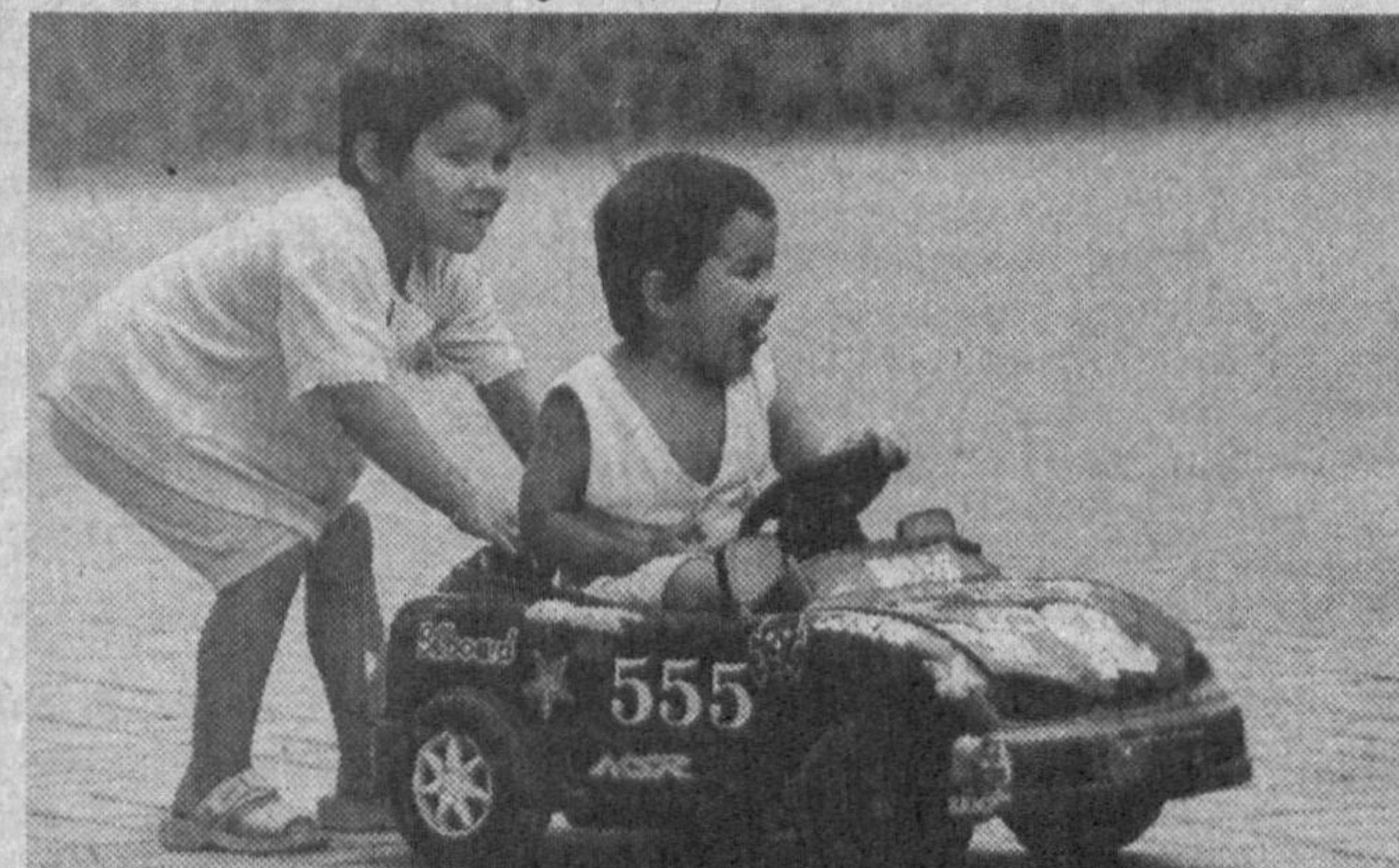
Первые уроки вождения...