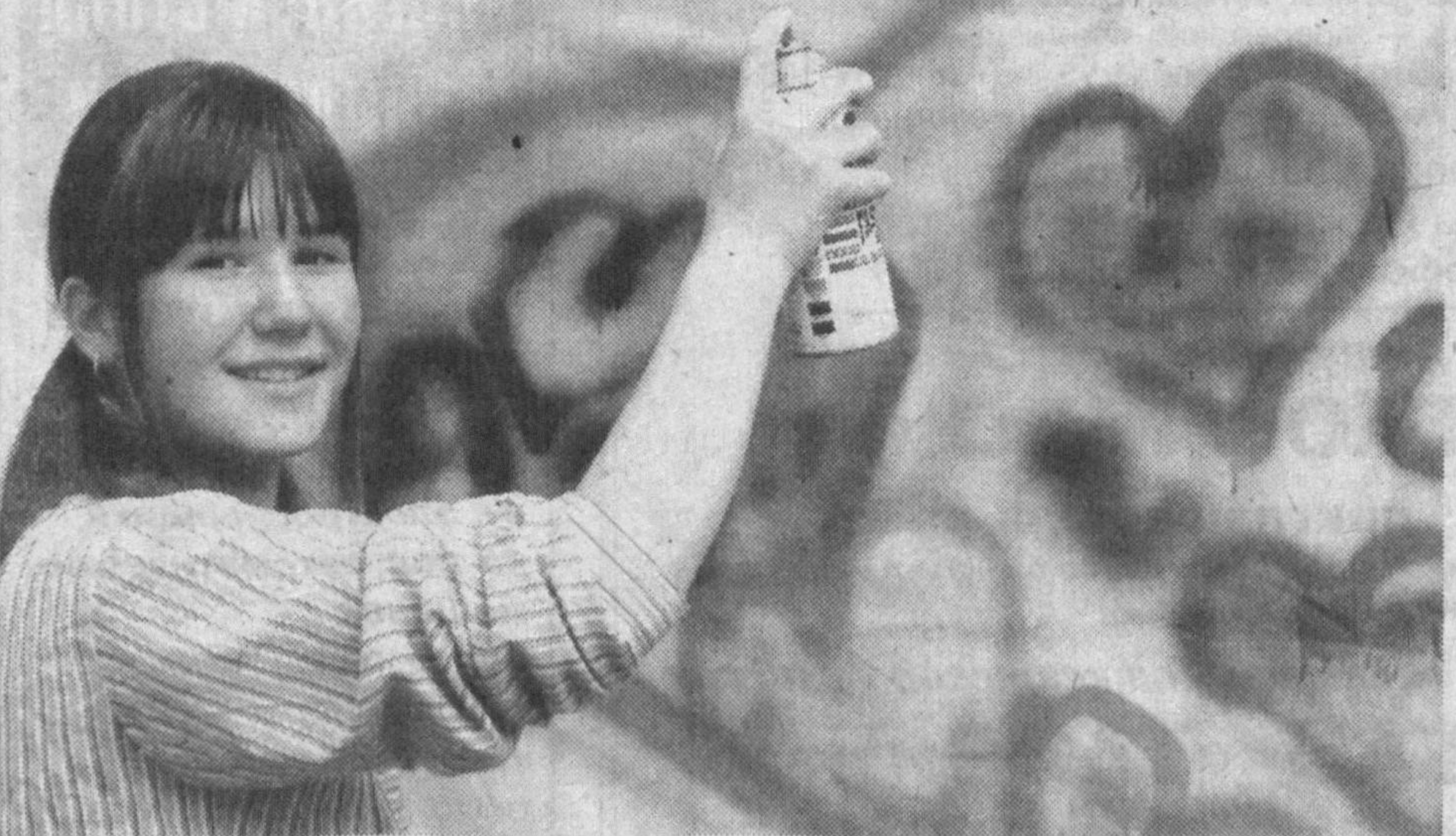
П. АН. НА СНИМКАХ: участники «МИМ» и их работы.

Сейчас готовятся к выходу картины «Я слышу мир глазами» — о глухих де-