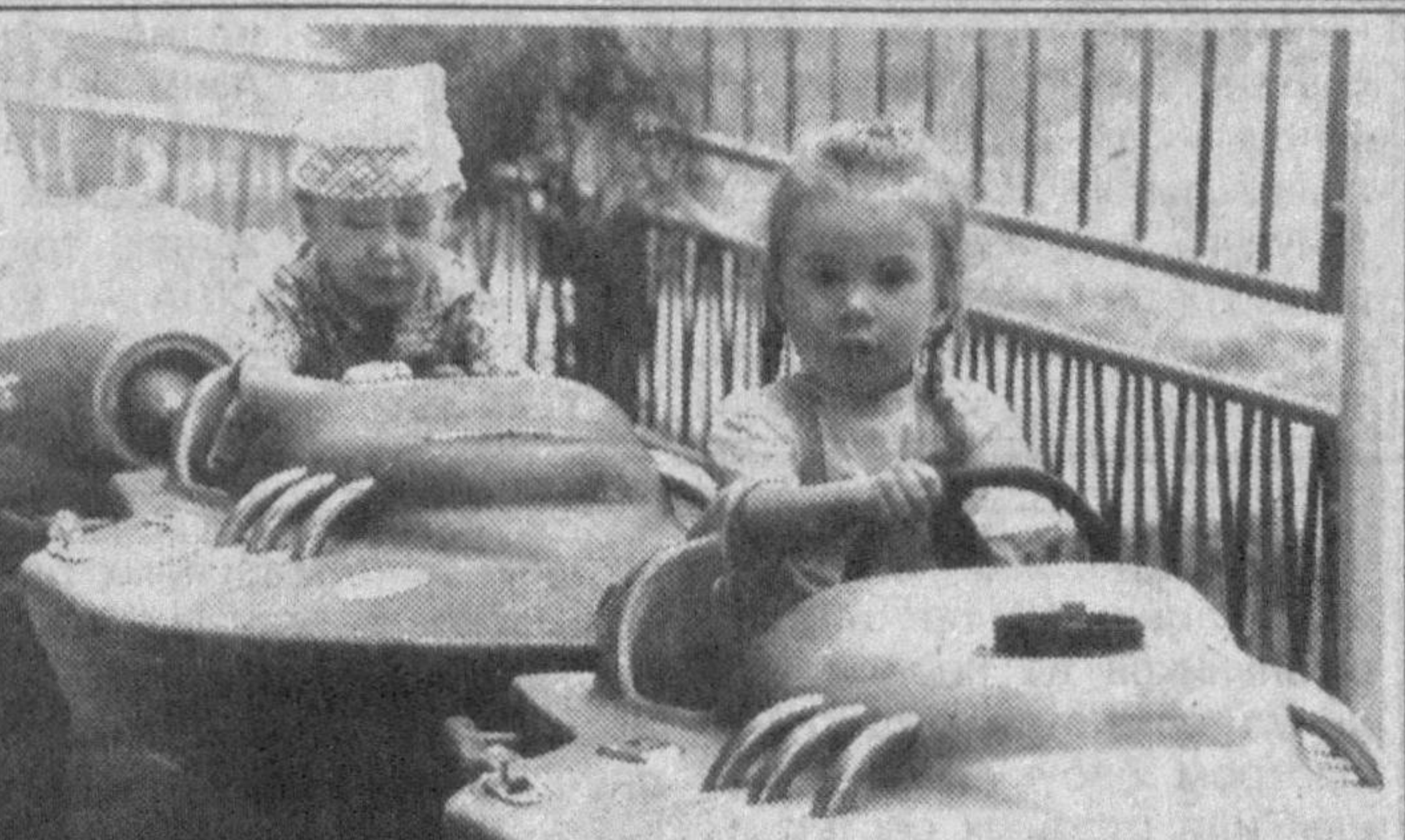
Юные водители...

А знаешь, есть еще и Мраморное море. Но и его назвали не из-за цвета волн, переливающихся на солнце — то они дымчато-