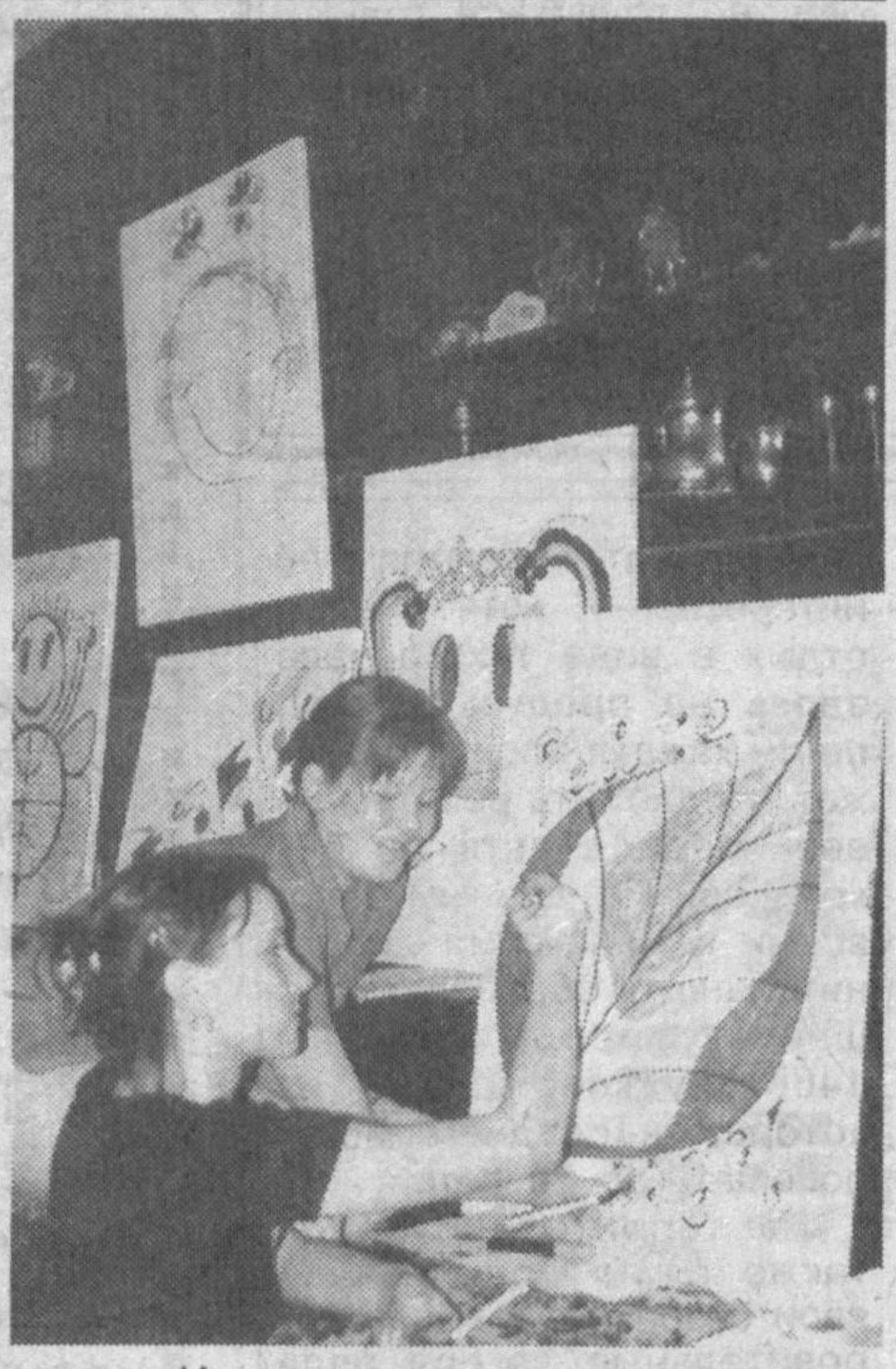
которых экспозиции детских рисунков и плакатов «Скажите детям: «Да!» и «Мир глазами детей». Но особой гордостью мастерской «МИМ» является создание телевизионных фильмов и роликов, посвященных социальным проблемам общества: жизни беспризорников, наркомании, загрязнению окружающей среды.

За сравнительно небольшое время существования творческой мастерской были проведены многочисленные художественные и фотовыставки, среди