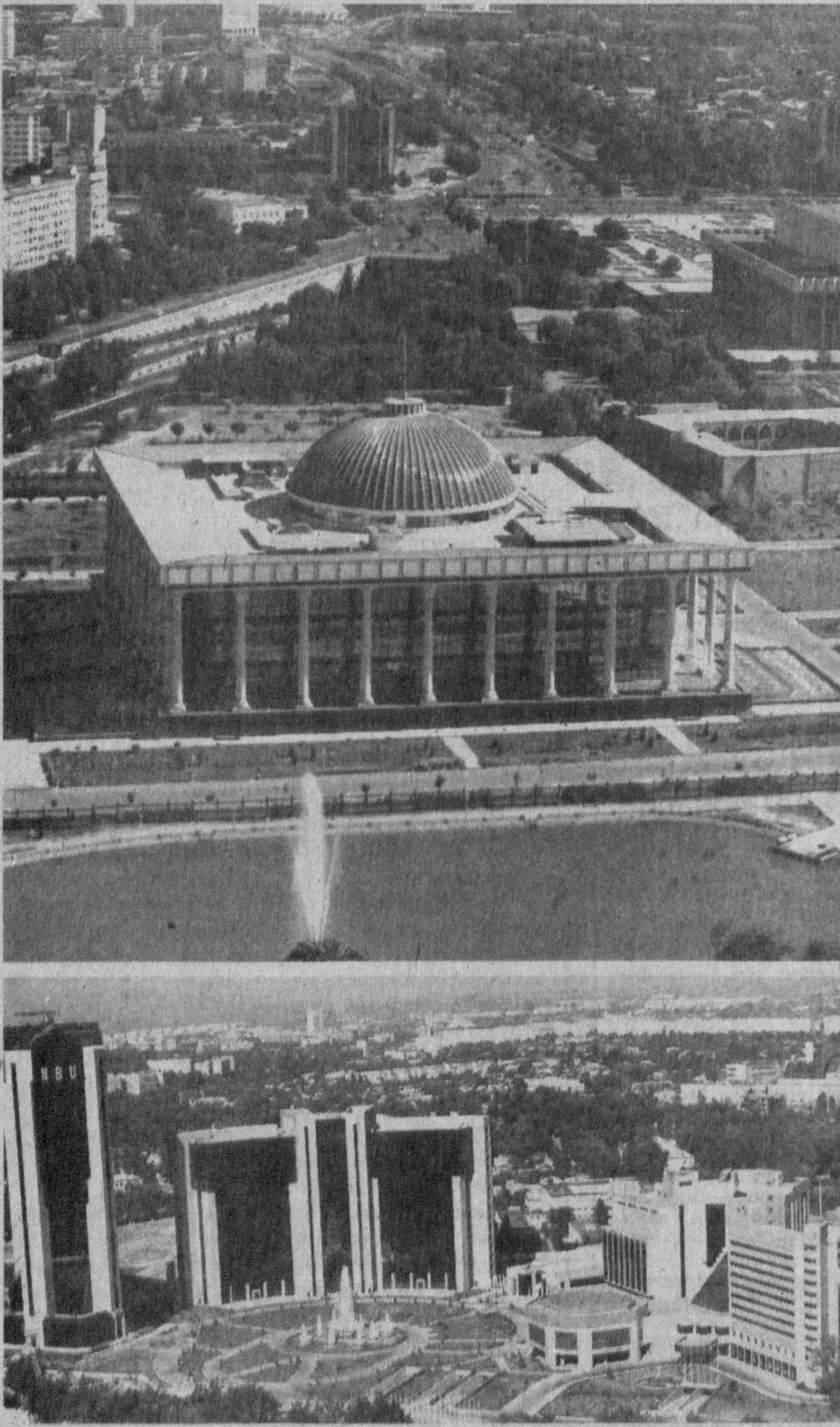
Современные силуэты столицы.