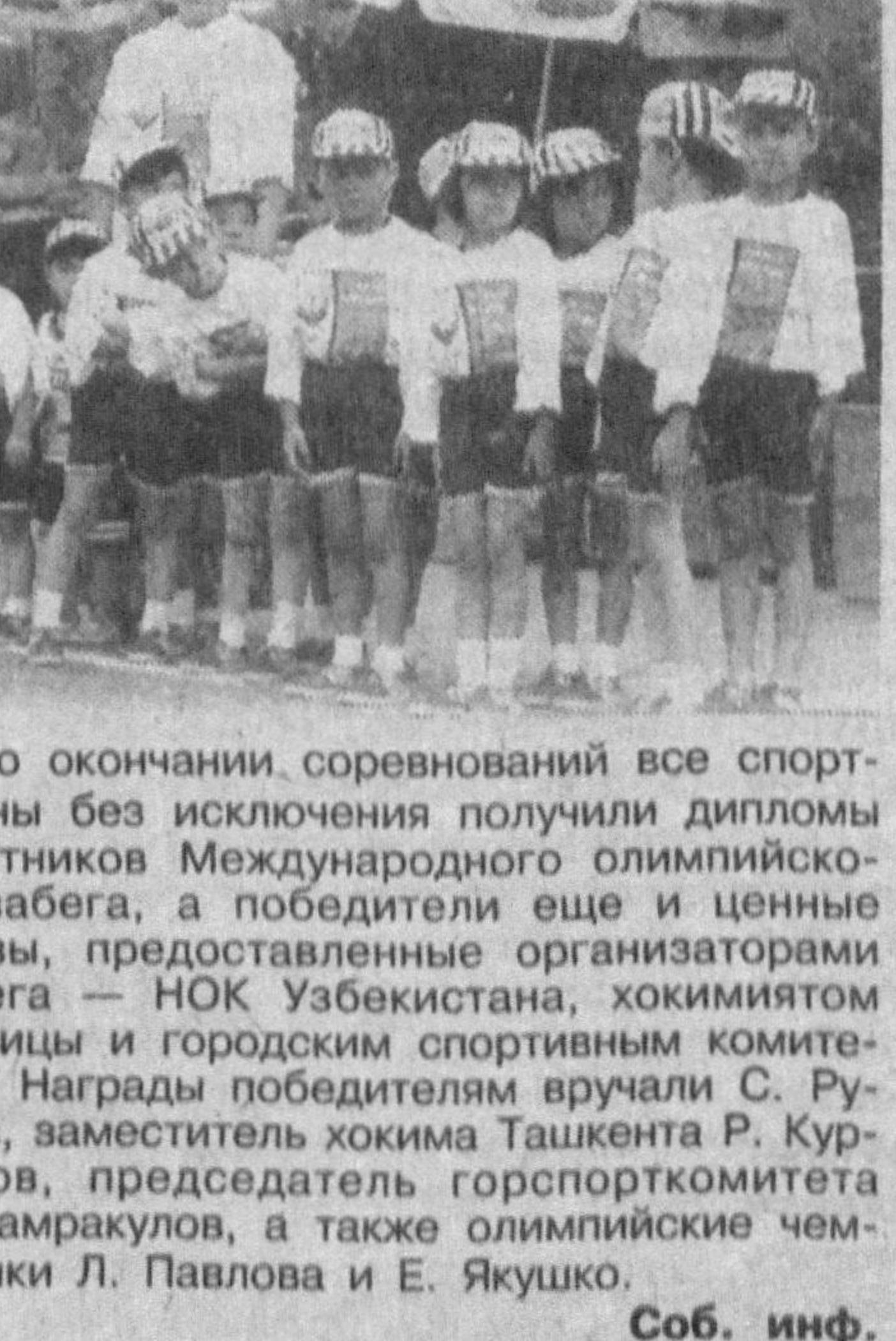
Соб. инф.