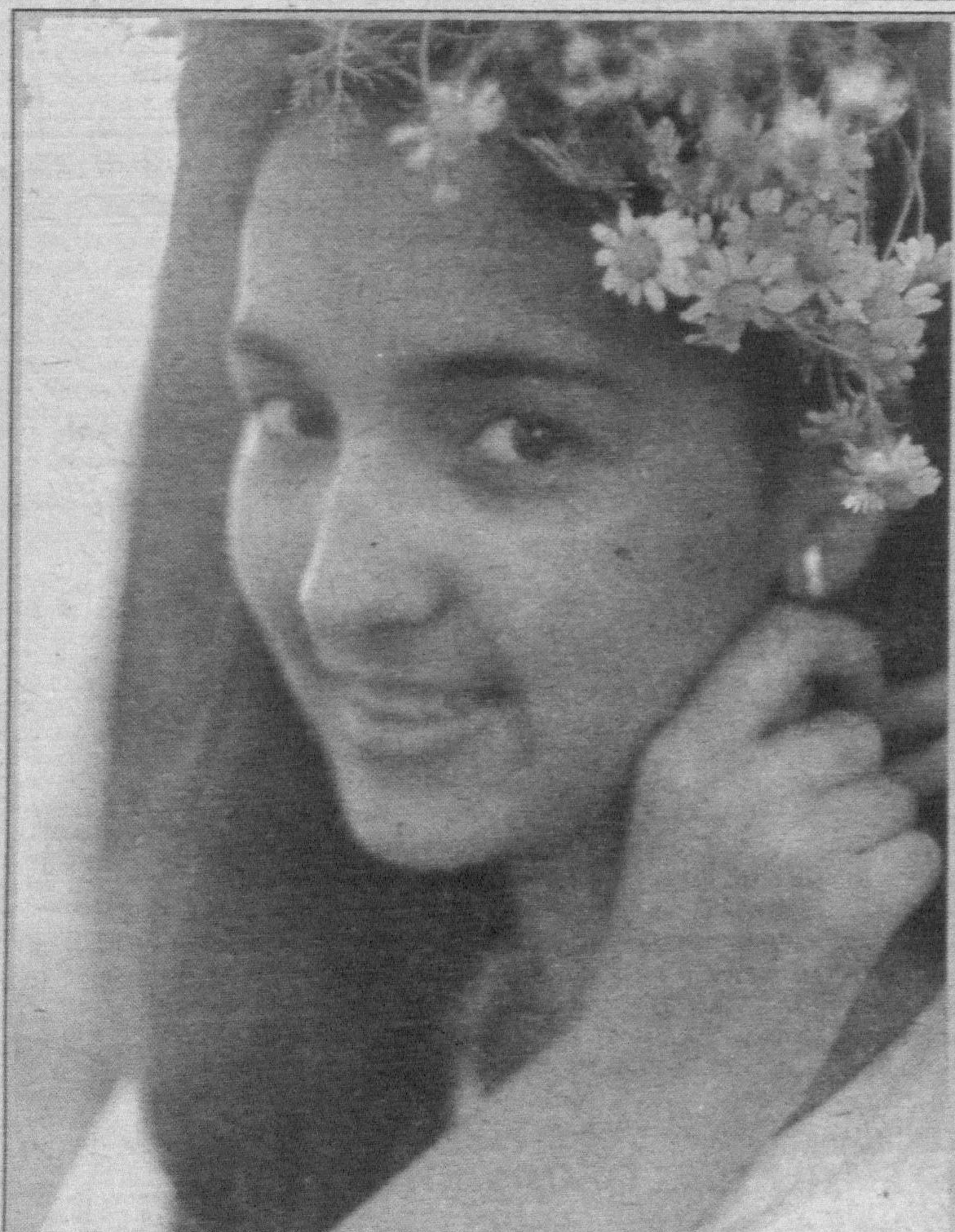
Я так хочу, чтобы лето не кончалось ...