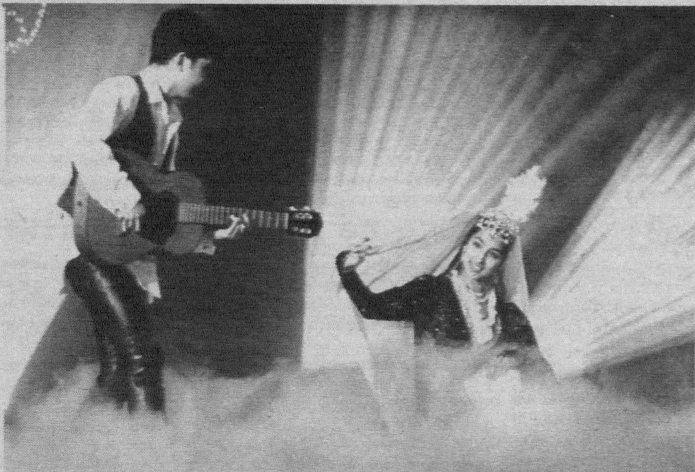
«Ты сыграй, а я станцую...»