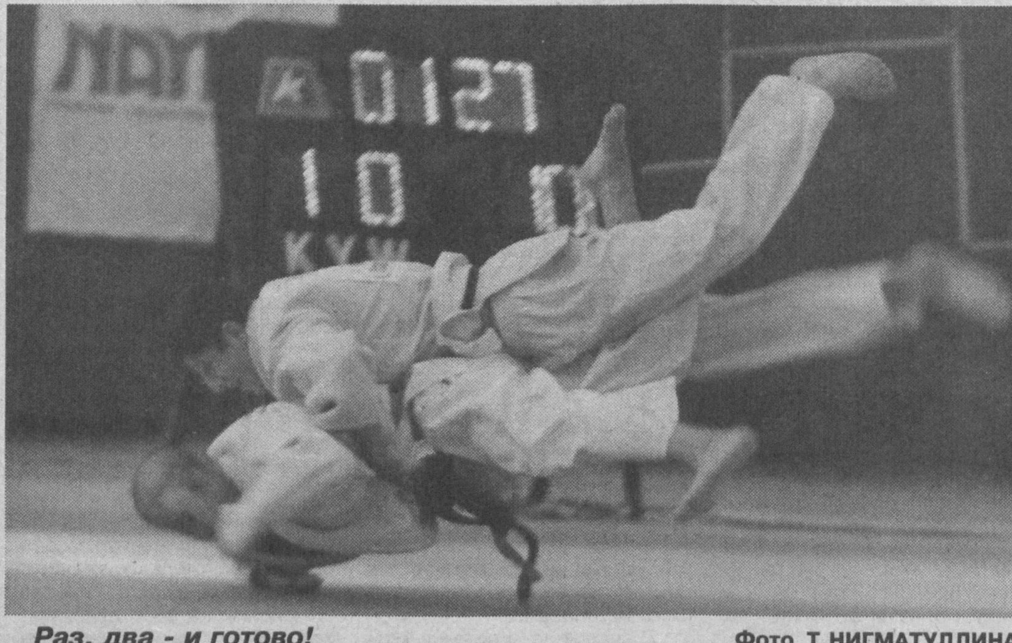
Стоп-кадр Раз, два - и готово!