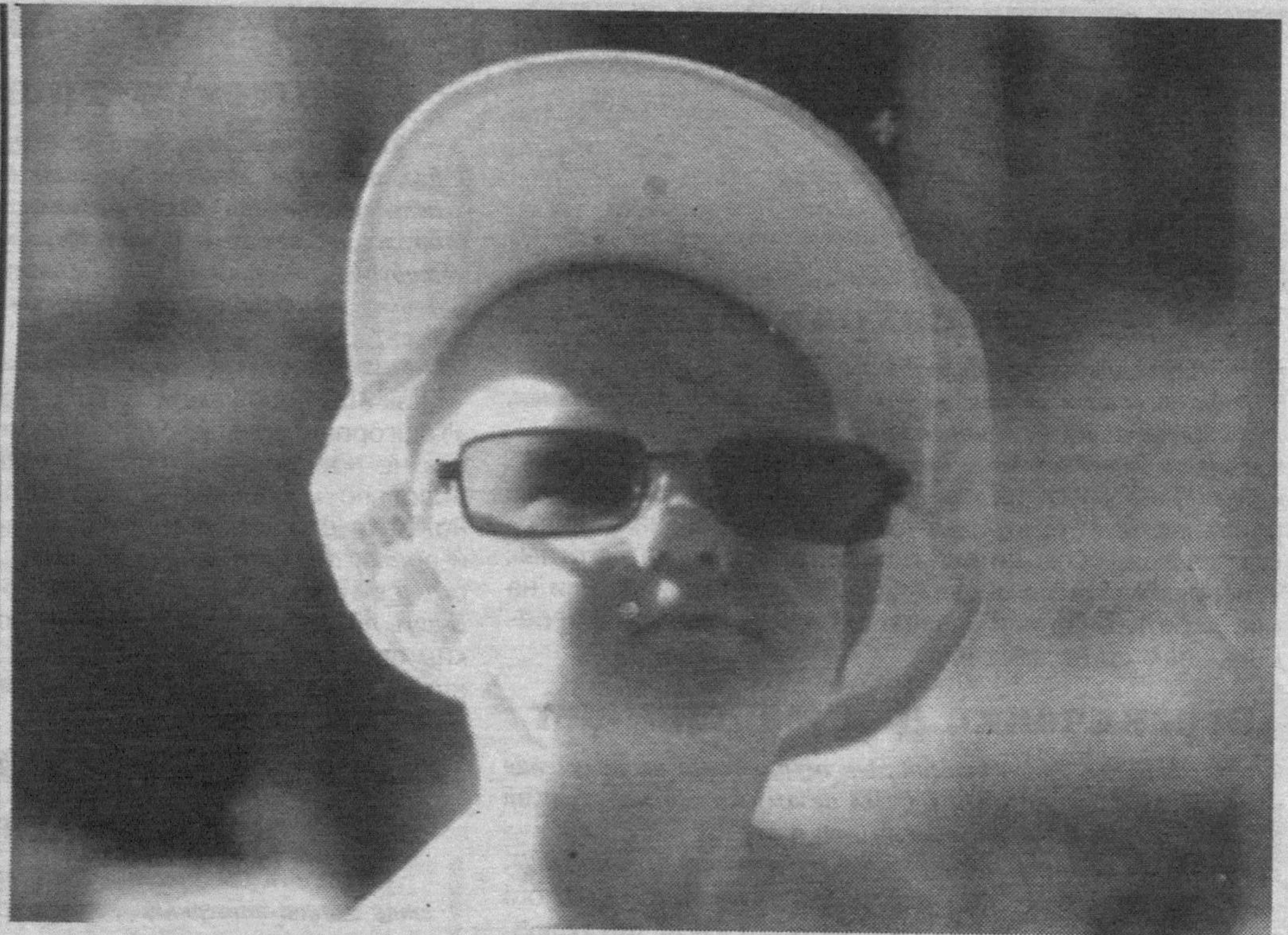
«Модна, красива, неприступна...»