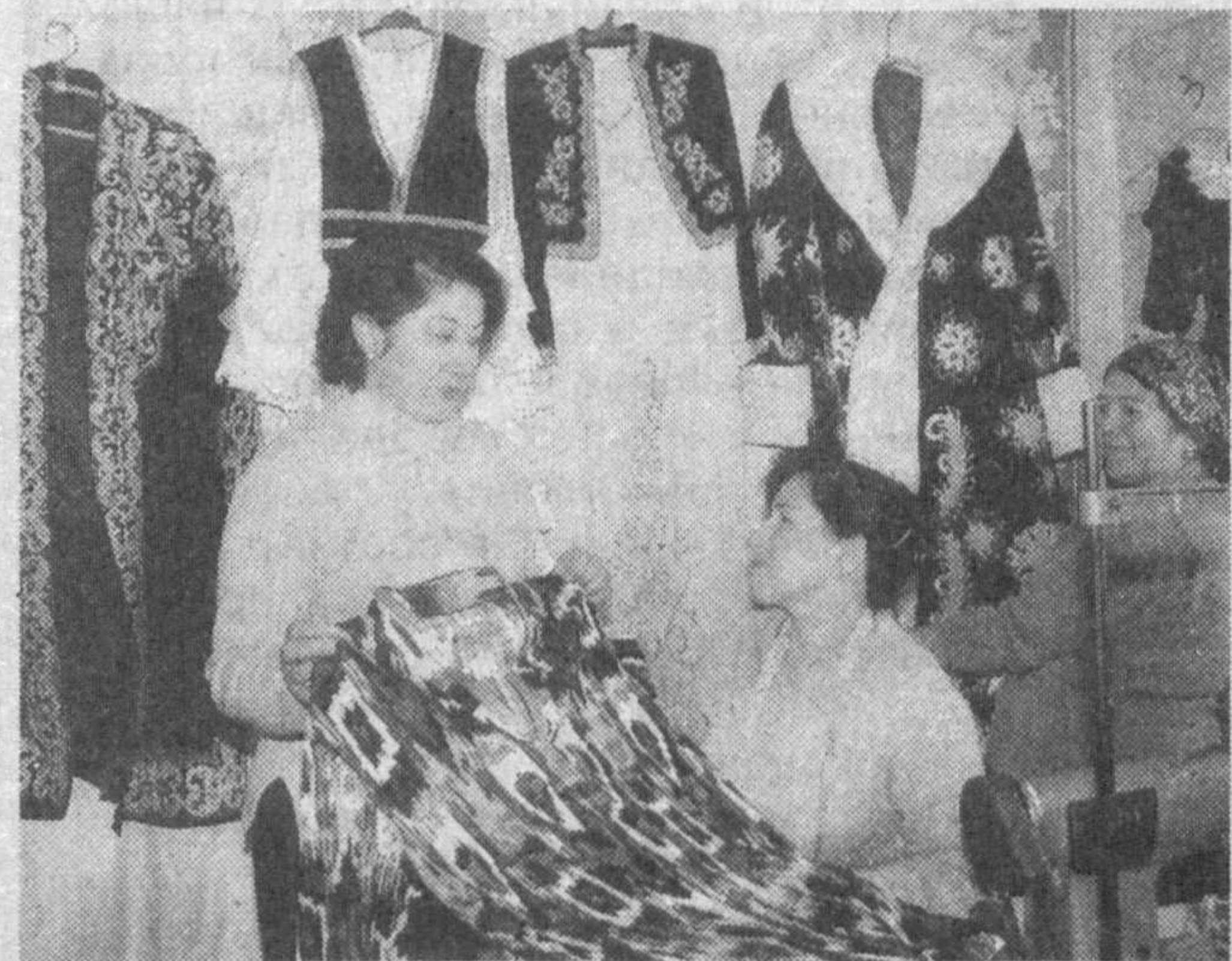
НИ ОДИН НАЦИОНАЛЬНЫЙ ПРАЗДНИК, ТЕАТРАЛИЗОВАННОЕ ПРЕДСТАВЛЕНИЕ ИЛИ КОНЦЕРТ НЕ ОБОЙДУТСЯ У НАС БЕЗ КРАСОЧНЫХ ДЕКОРАЦИЙ, ЯРКИХ КОСТЮМОВ ИСПОЛНИТЕЛЕЙ. МНОЖЕСТВО ЧАСТНЫХ ФИРМ, ШВЕЙНЫХ ЦЕХОВ ОСВОИЛИ ВЫПУСК НАЦИОНАЛЬНОЙ ОДЕЖДЫ, МАСКАРАДНЫХ КОСТЮМОВ.

Одна из таких швейных фирм — частное предприятие «Зузу», расположенное в Шайхантаурском районе. Здесь работают 12 женщин, настоящих мастеров своего дела. Это швеи, дизайнеры, модельеры. Если предстоит театрализованное представление в районном детском саду, в школе или Доме культуры, тут не обходится без костюмов швейной цеха «Зузу». Так, среди заказчиков фирмы — известный детский ансамбль «Севинч». Работницы швейной фирмы не только шьют национальные узбекские костюмы, но и одежду для творческих коллективов национальных культурных центров. Ежеквартальный объем заказов этого частного предприятия достигает 1,5 млн. сумов.