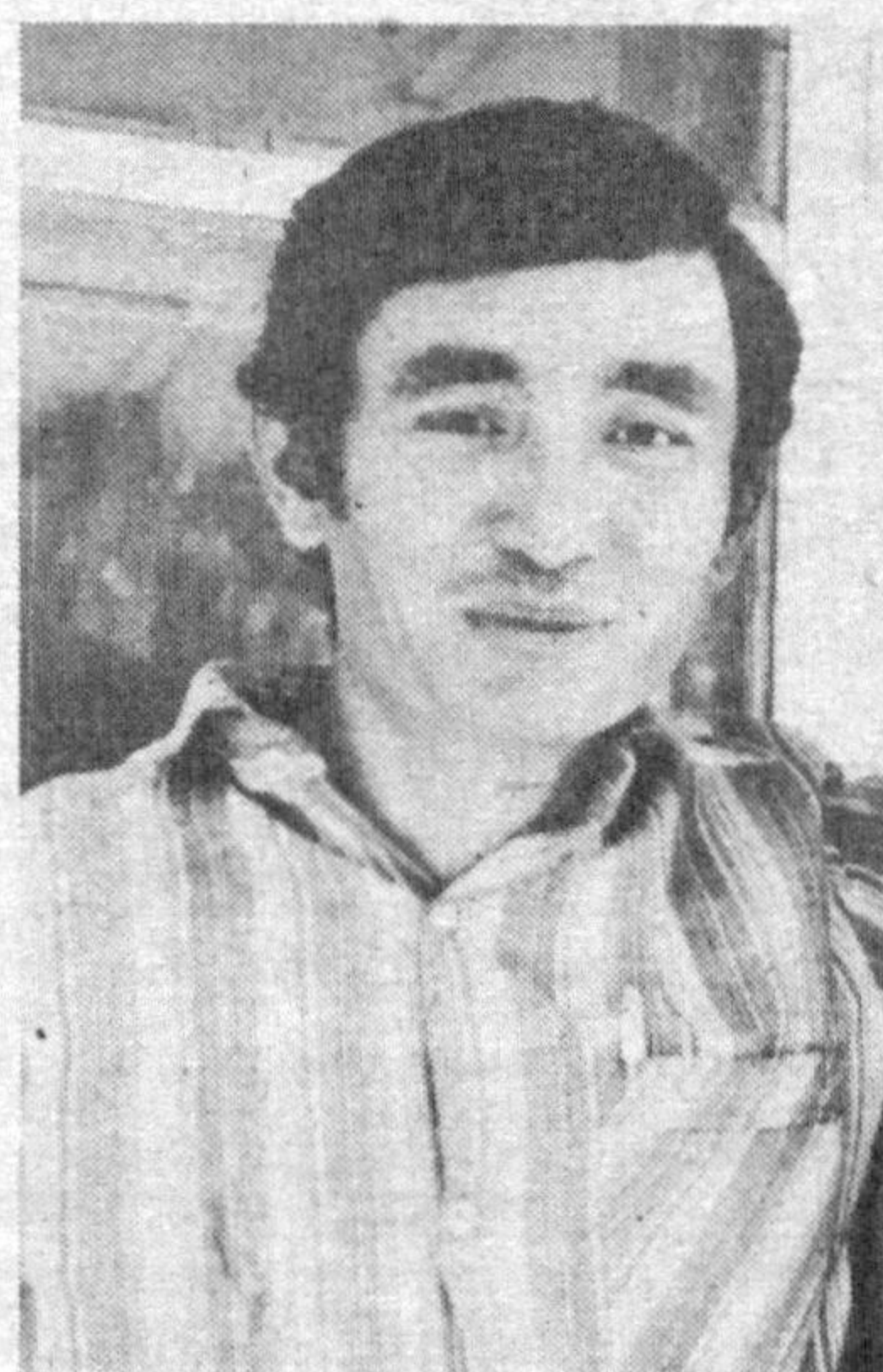
эдилар. Қарийб йигирма йилдан

Йиғлаётган қариндошлар эртага кула бошлар Сенинг эса жонинг билан чиқар дардинг танангдан. ЧАМБИЛБЕЛ Бир чуққисоқол сеҳргар узун режа тузиб, бу юртни қўз остига бостириб кетади.