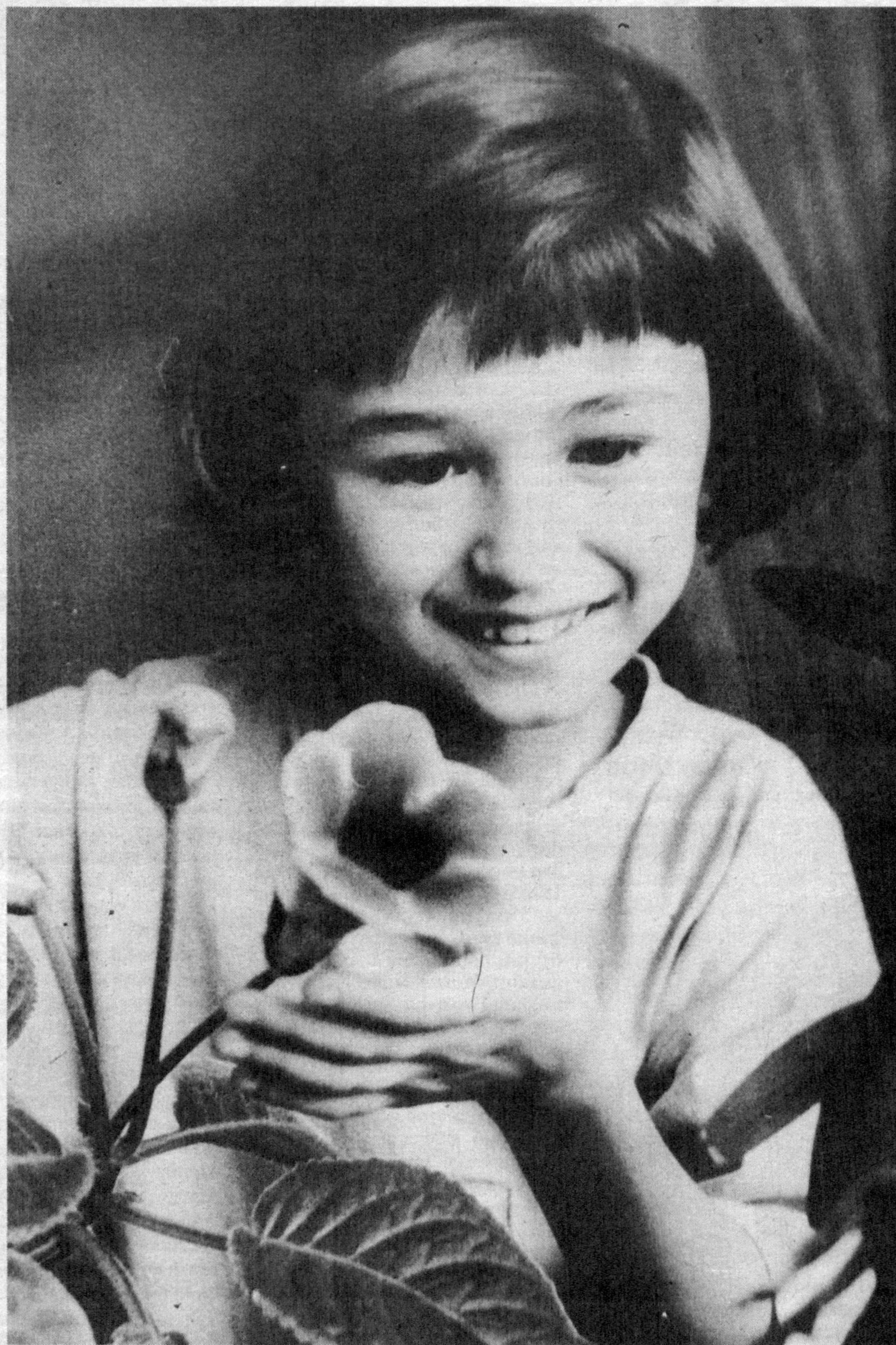
Кизга кубнар: Қарам ойишкан, Тун оғибди, кўрси бир жаҳон. Тун элалар: Жаҳонки қизалар, Миройиндан берин озрок.