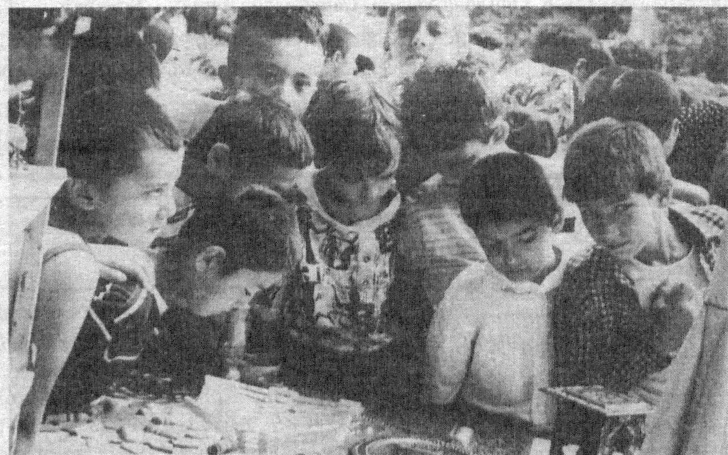
Суратларда: 1. Ваган тимсоллари билан танишув. 2. Тарбиячилар — ғамхўрлар билан хайрлашув пайти.

Яқинда бу ерда боғча билан хайрлашув кечаси булиб ўтди. Алоҳида байрам тусини олган маросимга болалар байроғимиз, тамғамиз, қомусимиз расминини чизиб, шеърлар ёд олиб келишибди. Ҳатто баъзилари бу муқаддас тимсоллар тасвирини ипак билан тикишга ҳам ҳаракат қилишибди. Она Ватан, унинг шарбатга тула боғлари, пахтамиз, бугдойимиз, қазилма бойликларимиз ҳақидаги эркин ҳикоялари бу ерга йиғилган ота-оналарни ҳам хурсанд қилди. Кеча охиридаги қушиқлар, рақслар барчани хушнуд элди.