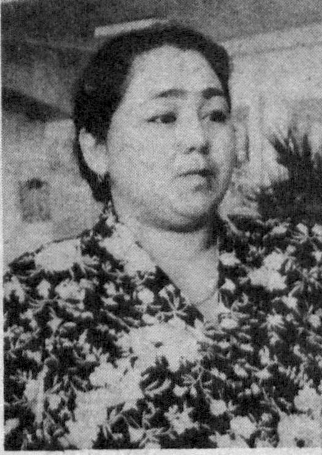
Мен соҳибкирон Темурнинг юрти Кешданман. Албатта ҳозир шаҳримизнинг номи Шаҳрисабз деб аталади. Негадир буюк бобомиз Амир Темур яшаб утган бу Ватанда