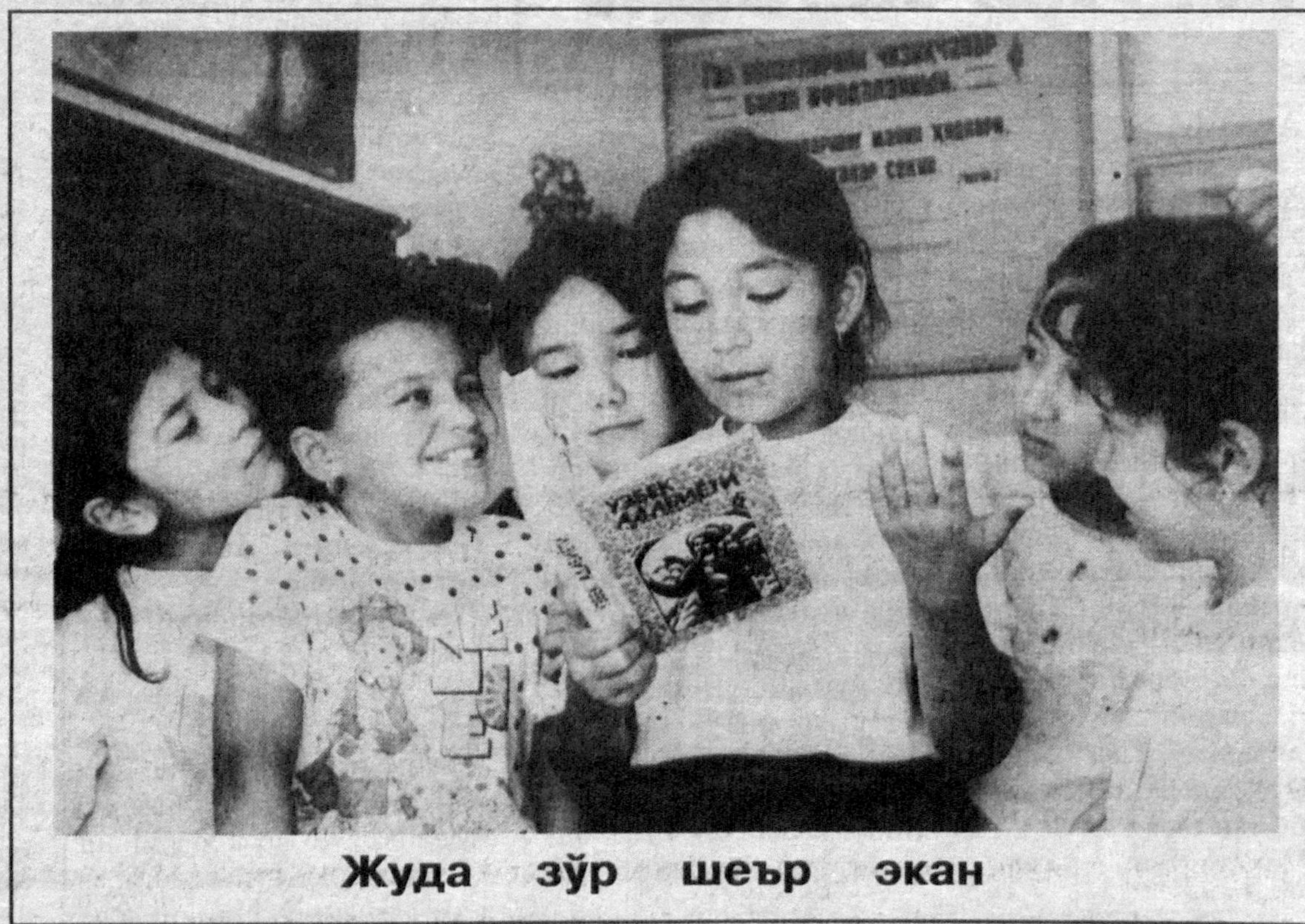
Жуда зўр шеър экан

Ибн Арабшоҳ, Фосих Ҳавофийнинг соҳибқирон ҳақида