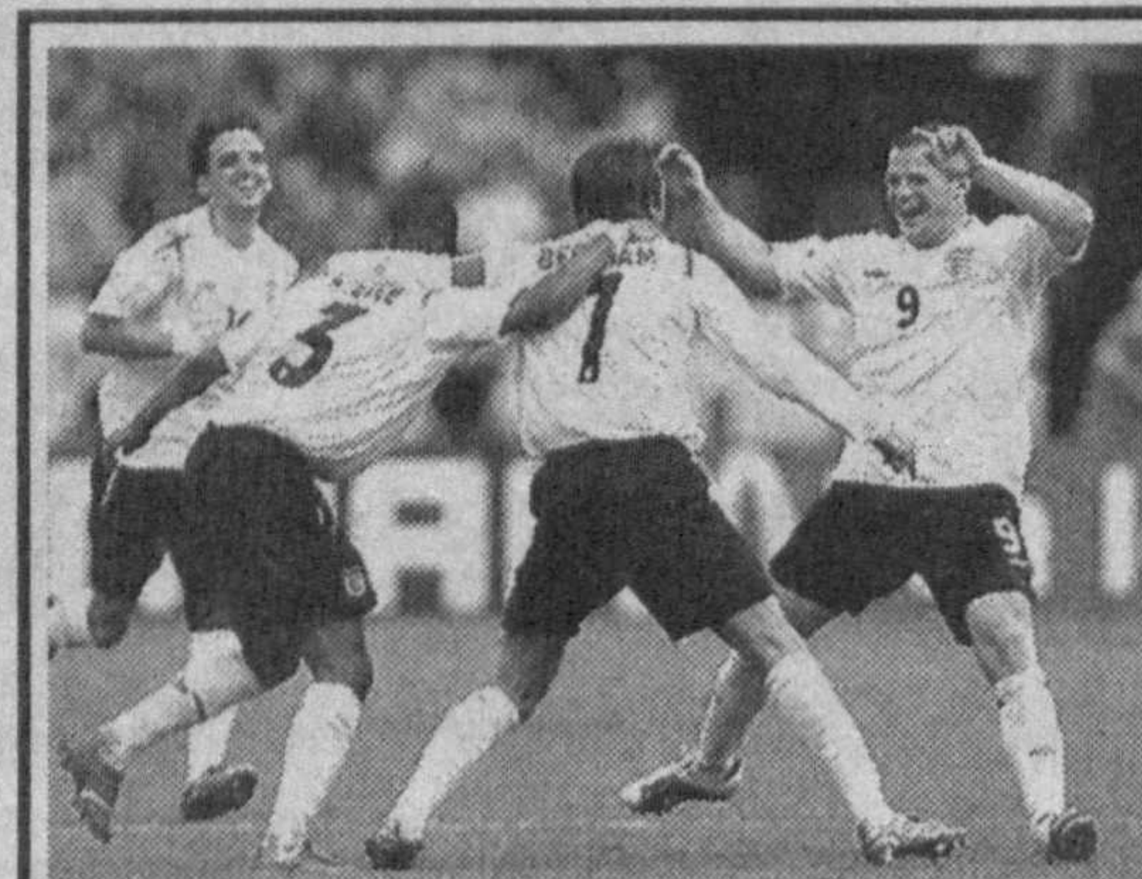
Участники чемпионата мира по футболу эмоции выражают бурно. Еще бы такая игра...

В розыгрыше Кубка Узбекистана по футболу завершились первые матчи 1/4 финала. «Пахтакор» и «Машъал» с одинаковым счетом 4:1 обыграли соответственно команды «Металлург» и «Бухара».