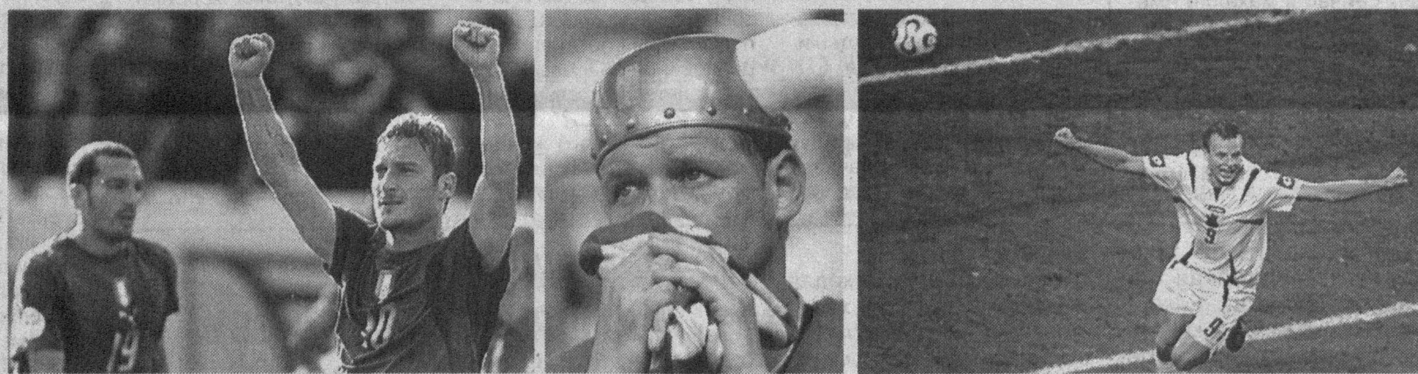
На чемпионате мира по футболу: радость победы и огорчения.