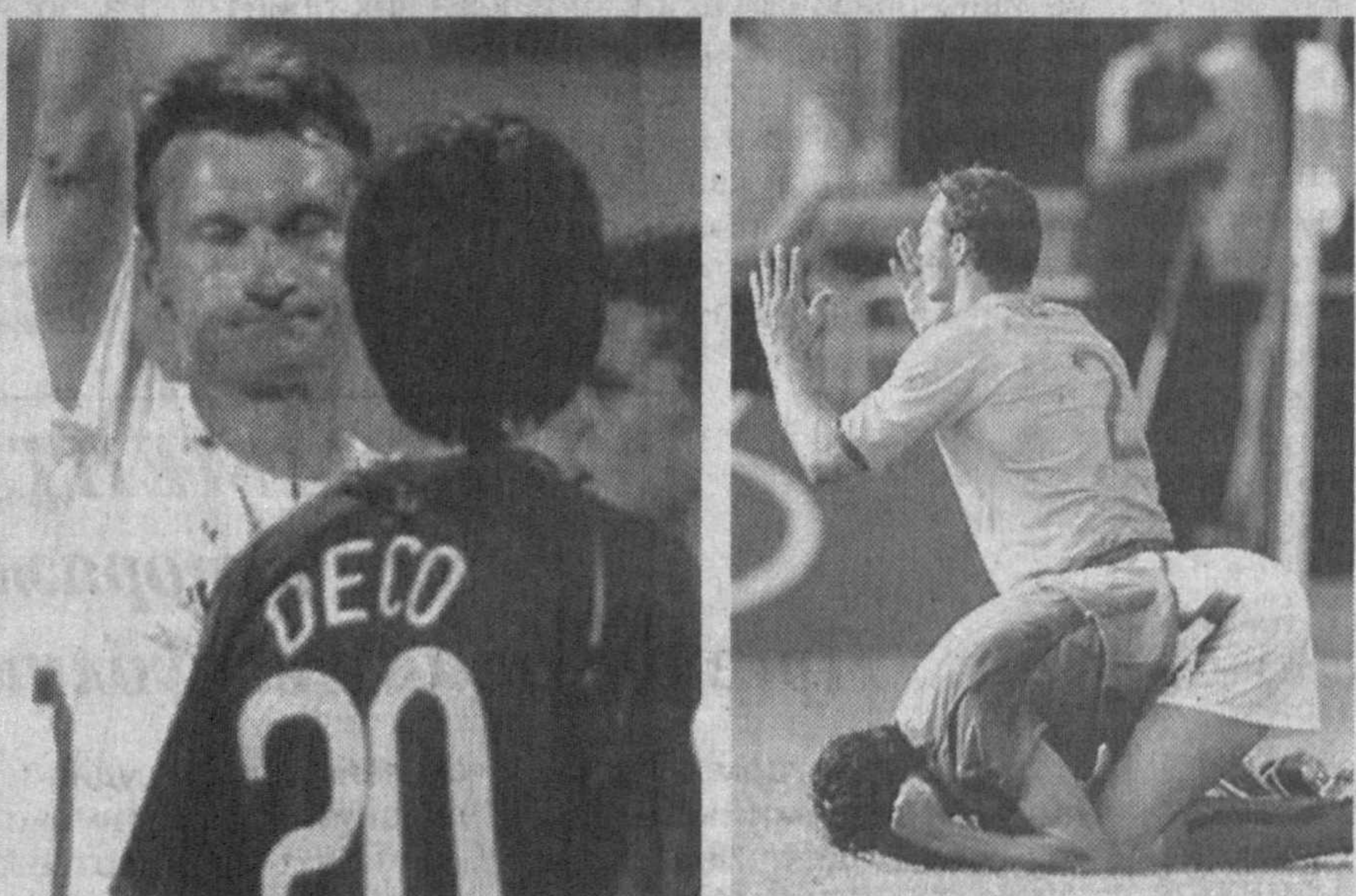
Радость победы и горечь поражения — на чемпионате мира по футболу возможно все.

НЕОБЫЧНЫЙ МУЗЕЙ ОТКРЫЛСЯ В ТАШКЕНТЕ В СВЯЗИ С ТРИДЦАТИЛЕТИЕМ ВЫСТАВОЧНОЙ ДЕЯТЕЛЬНОСТИ НАРОДНОГО ХУДОЖНИКА УЗБЕКИСТАНА ЛЕКИМА ИБРАГИМОВА. ВЕРНИСАЖ, СОБРАВШИЙ ЛУЧШИЕ ЖИВОПИСНЫЕ ПОЛОТНА МАСТЕРА ХОЛСТА, ВРЕМЕННО РАЗМЕСТИЛСЯ В КОМНАТАХ ЕГО ДОМА, ОЖИДАЯ ОТКРЫТИЯ НОВОГО ВЫСТАВОЧНОГО СЕЗОНА. ПОМОГАЛИ ОТБИРАТЬ ПОЛОТНА ДРУЗЬЯ-ХУДОЖНИКИ И ЧЛЕНЫ СЕМЬИ, КОТОРЫЕ ПРЯМО ИЛИ КОСВЕННО ПРИЧАСТНЫ К ХУДОЖЕСТВЕННОМУ ПИСЬМУ.