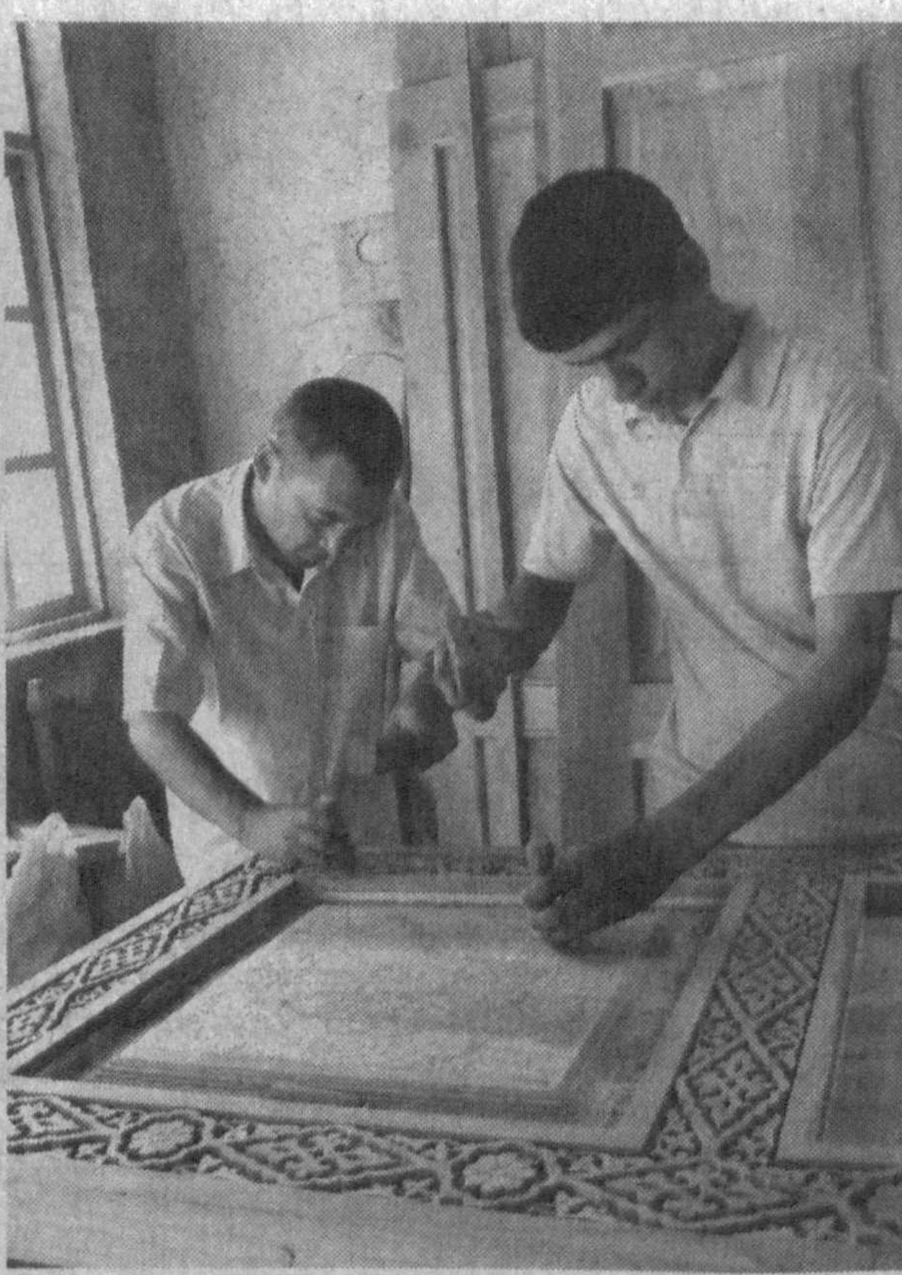
Народные умельцы за работой.