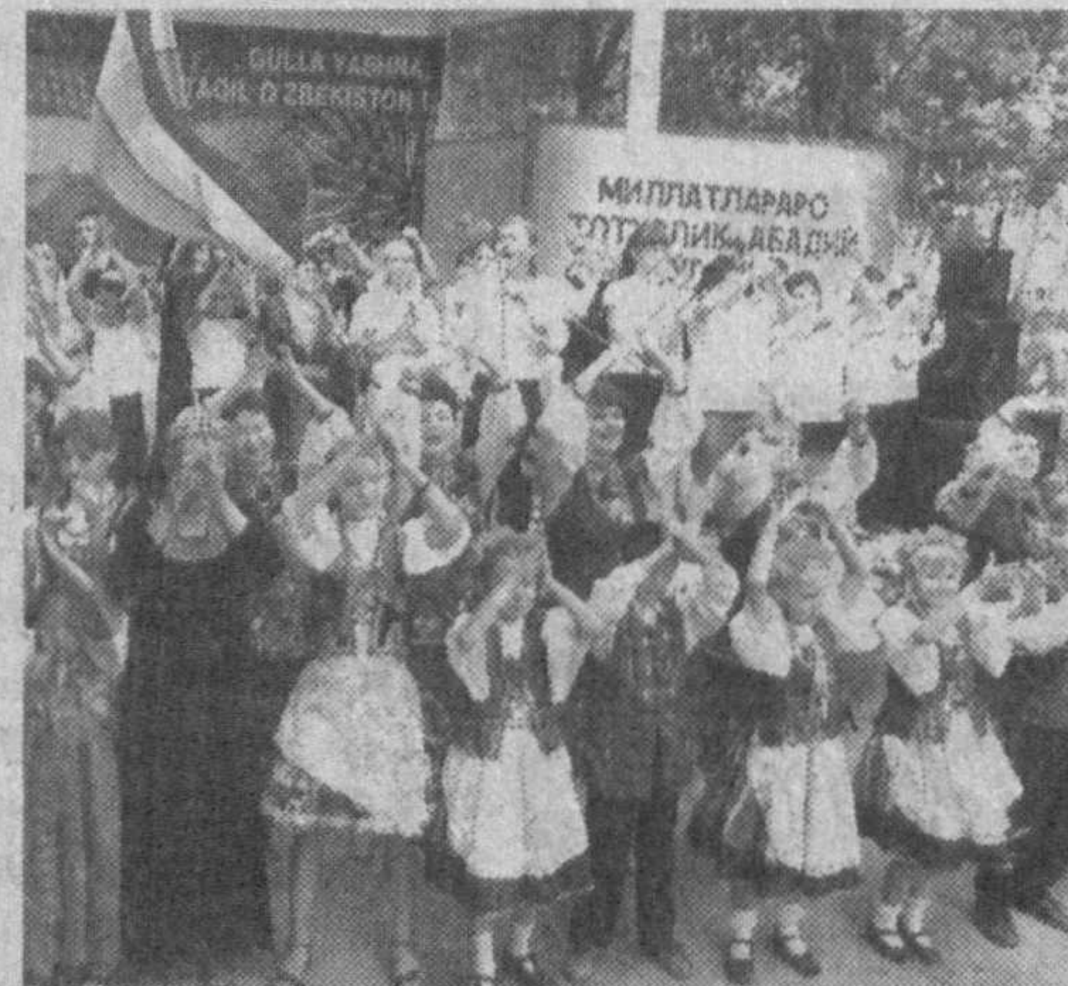
В каждом ребенке заложено творческое начало, и родители вместе с педагогами развивают эти добрые ростки.