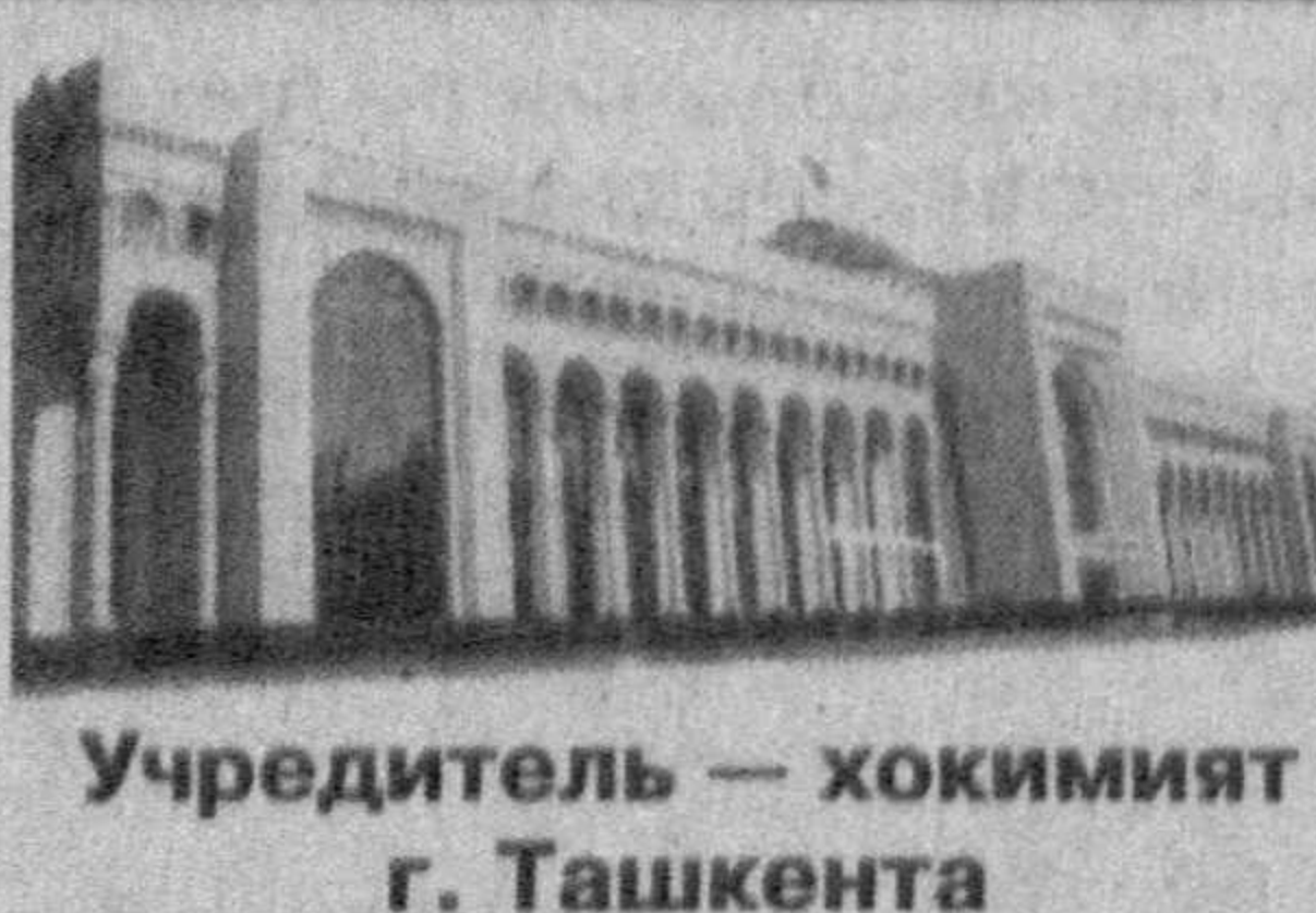
Учредитель — хокимият г. Ташкента

Она долговечна. Деревья в возрасте 200-250 лет не редкость, отдельные же виды доживают до 300-400 лет. Сосна — замечательное дерево. Все в ней — от хвои до корня — используется человеком. Из смолистой древесины сосны получают лучшие пиломатериалы. Это ценное сырье для лесохимической промышленности. Из нее получают скипидар, канифоль и много других ценных продуктов.