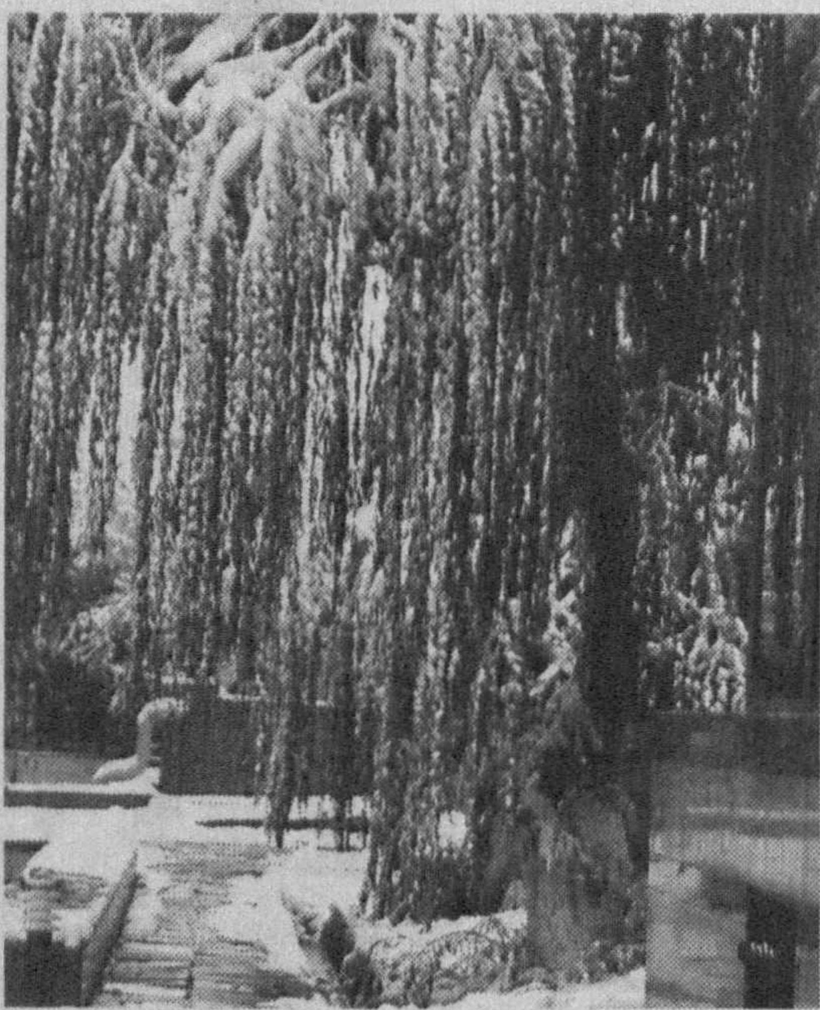
Снег идет, и все в смятении Удивленный пешеход, Убеленные растения, Перекрестка поворот.