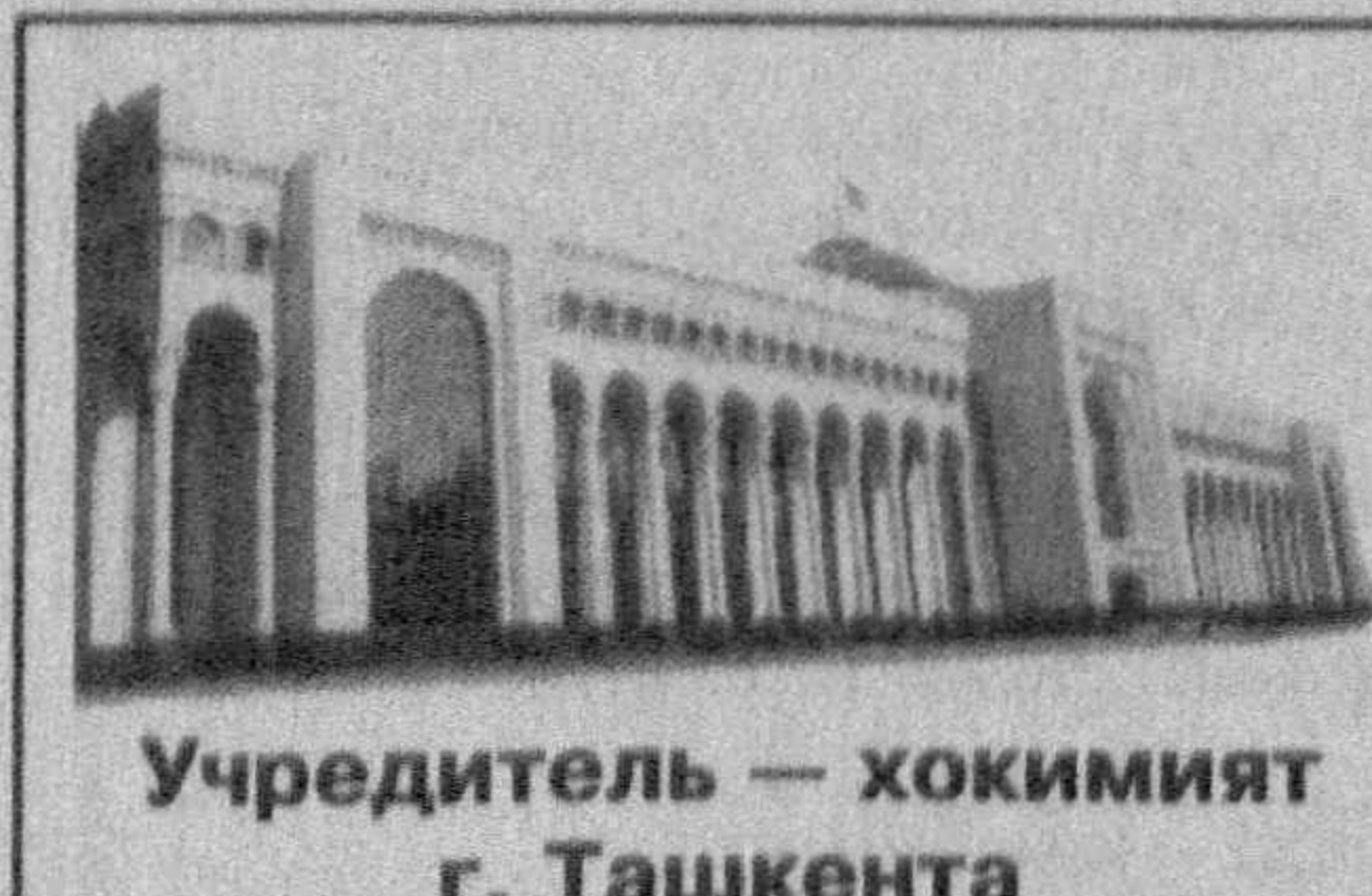
Учредитель - хокимият г. Ташкента

Прием объявлений ежедневно (кроме субботы и воскресенья) ТЕЛЕФОН ДЛЯ СПРАВОК: 133-28-95.