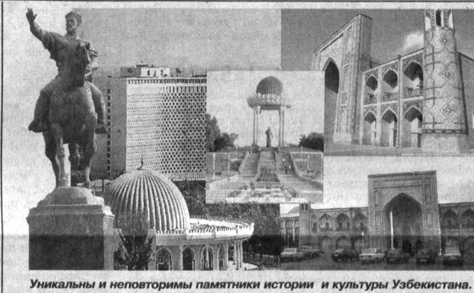
Уникальны и неповторимы памятники истории и культуры Узбекистана.

Набор учащихся в школу значителен и зависит от желания тренера, в последующем заметен и естественный отсев. Как говорил русский сатирик Козьма Прутков, «сие занятие не всем по плечу». В группе начальной подготовки осваиваются азы шахмат; на второй год обучения школьники стараются выполнить разряды в различных соревнованиях (не у всех это получается). Затем занятия идут индивидуально: по договоренности дома у тренера или ученика. Педагоги заинтересованы в способных учащихся (надо выполнять разрядную программу). Они стараются пристраивать своих воспитанников в городские и престижные республиканские турниры, где советами помогают ученикам стать кандидатами в мастера.