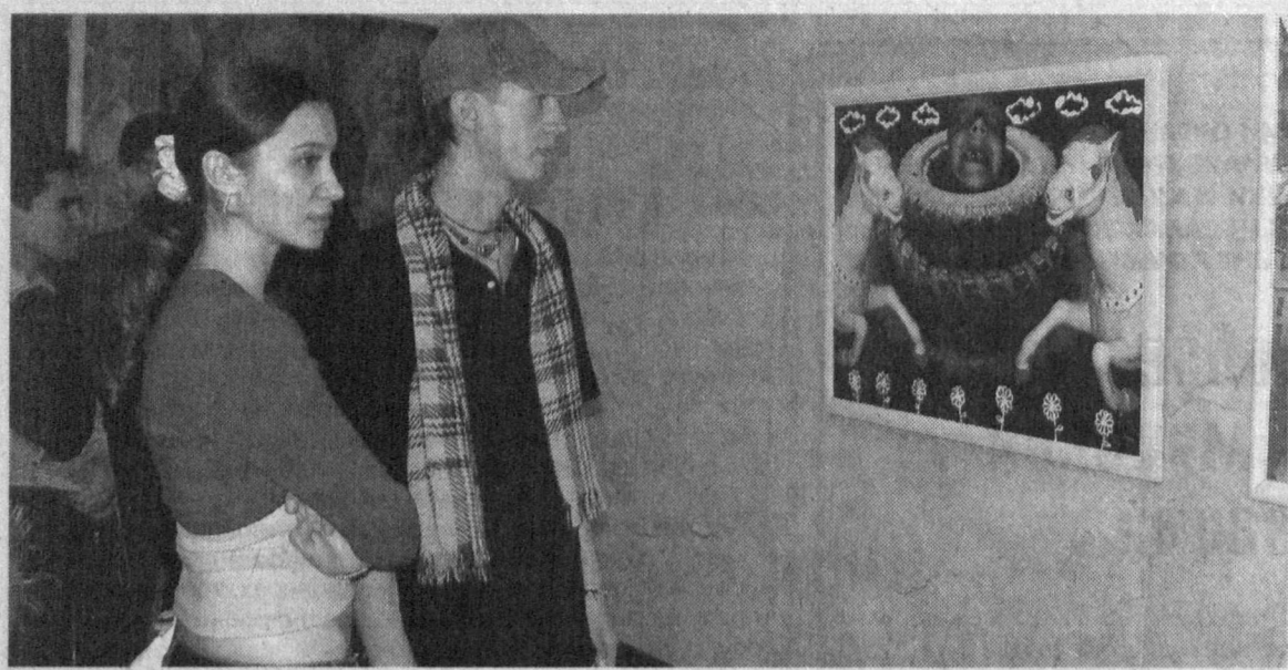
В ГАЛЕРЕЕ ИЗОБРАЗИТЕЛЬНОГО ИСКУССТВА УЗБЕКИСТАНА РАЗВЕРНУТА ЭКСПОЗИЦИЯ АКТУАЛЬНОГО ИСКУССТВА «КОНСТЕЛЛЯЦИЯ. ПОСТСКРИПТУМ», ОРГАНИЗОВАННАЯ ШВЕЙЦАРСКИМ АГЕНТСТВОМ ПО РАЗВИТИЮ И СОТРУДНИЧЕСТВУ.