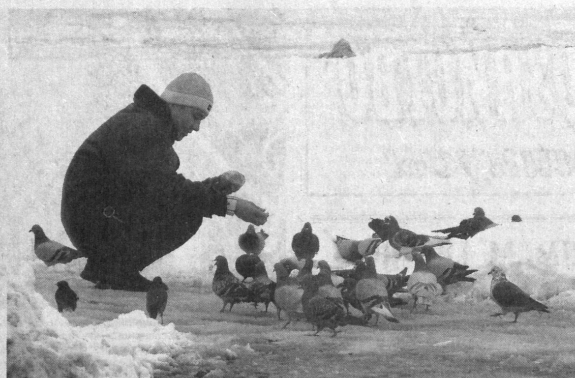
Кто еще позаботится о пернатых, как не мы, люди.

Сверкнула луч солнца, дерзостен и меток!.. А после — там, в толпе людской, возник, Остановившись бесмысленность движенья, До странности родной, прекрасный Лик Неведомого смысла и значения. Откуда он? Из жгучей тайны сна? Из Прошлого укором вездесущих? Иль в этот миг причудлива-Весна Зовет изведать счастье дней грядущих?.. А может быть, создав сквозь толщу туч Лишь памятник несбывшимся всем грезам, Весна с улыбкой дарит первый луч Сердцам, так крепко скованным морозом?