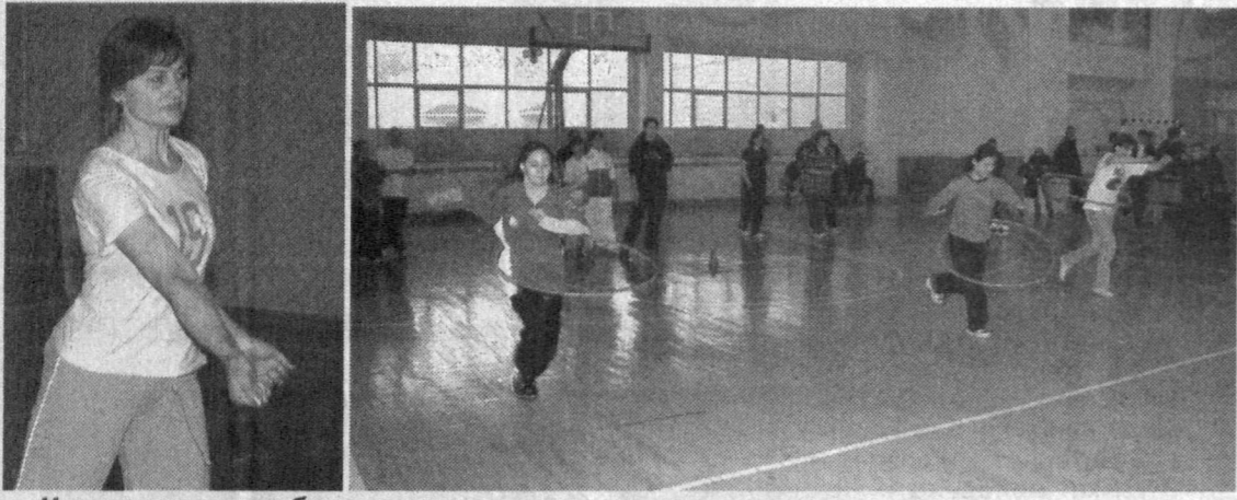
Нам под силу все барьеры, и не только в спорте.