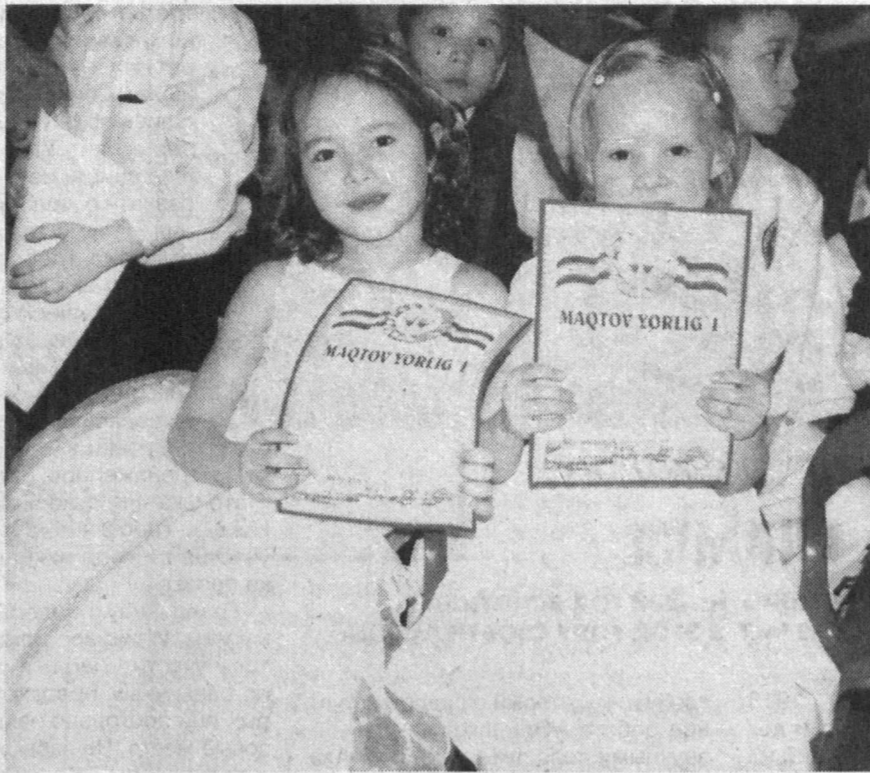
А. БЕЗРУЧКО.

НА СНИМКАХ: дети радуются, когда показывают свое творчество сверстникам и взрослым, одариваящим их своим вниманием и заботой.