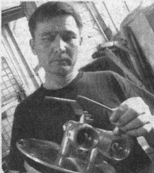
НА СНИМКАХ: в цехе предприятия.

Большой популярностью у потребителей пользуются и системы очистки питьевой воды. В отличие от многих зарубежных аналогов, где применяется пластмасса, в оборудовании «Акватех» используется нержавеющая сталь, что позволяет значительно увеличить срок его эксплуатации. Передовые технологии позволяют из любой, например, артезианской, воды получить питьевую, при этом отказавшись от