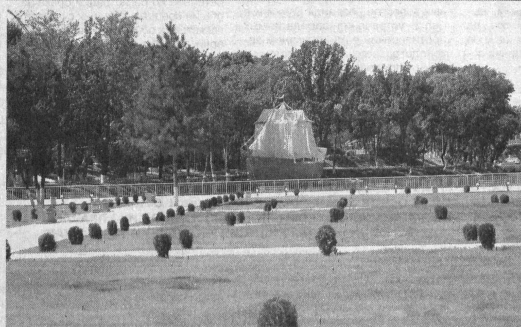
Спортивные сооружения, построенные в годы независимости, такие, как спорткомплекс «Авиасозлар», представляют желающим большой выбор спортивных секций, а в парке им. А. Навои можно позаниматься активным отдыхом.