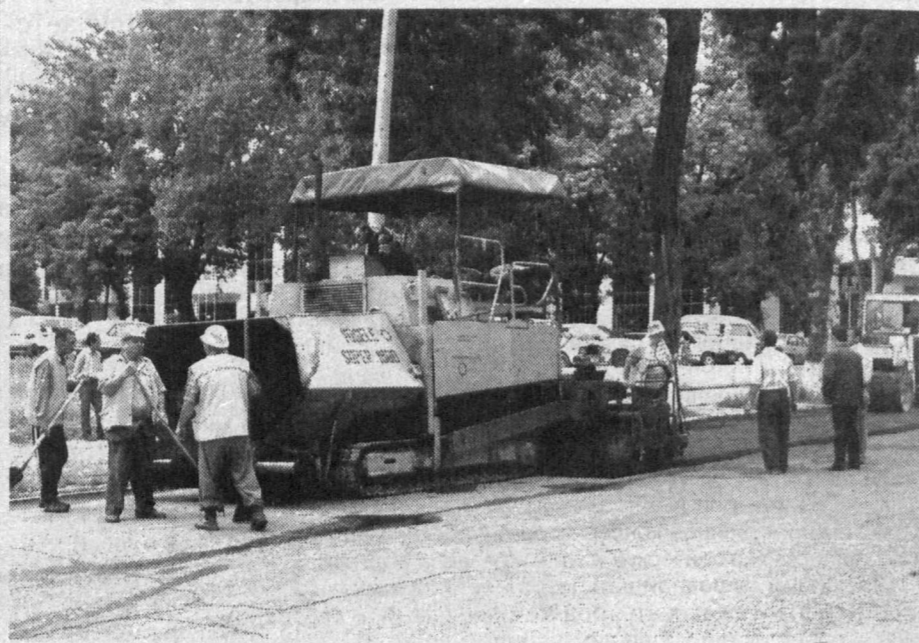
В эти дни дорожные работы активно ведутся на улице Матбуотчилар, где трудятся специалисты «Гордорстройремонта». Рабочие делают замеры, устанавливают бордюры и укладывают асфальт. Работа людей и техники не прекращается ни на минуту, и скоро по обновленной трассе поедут автомобили.

СОВРЕМЕННЫЙ И КРАСИВЫЙ ГОРОД — ЭТО НЕ ТОЛЬКО ЗЕЛЕННЫЕ НАСАЖДЕНИЯ, ВЫСОТЫЕ ЗДАНИЯ, БЛАГОУСТРОЕННЫЕ МИКРОРАЙОНЫ, НО И СЕТЬ ШИРОКИХ АВТОМАГИСТРАЛ, ДОРОГ, МОСТОВ, ОБЛЕГЧАЮЩИХ ДВИЖЕНИЕ АВТОМОБИЛЕЙ И ПЕШЕХОДОВ, ОБЕСПЕЧИВАЮЩИХ ИХ БЕЗОПАСНОСТЬ.