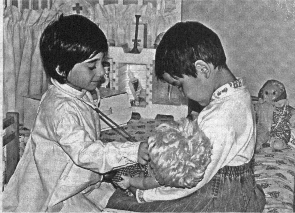
Мы еще маленькие, но нам все интересно.