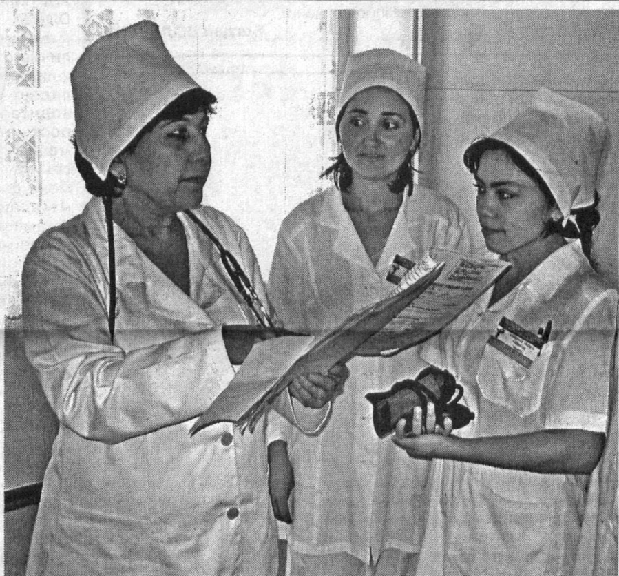
В лечении любого заболевания особое значение уделяется правильной постановке диагноза, неуклонному выполнению медицинскими сестрами назначений врача. В Ташкентской медицинской академии свято придерживаются этих правил.