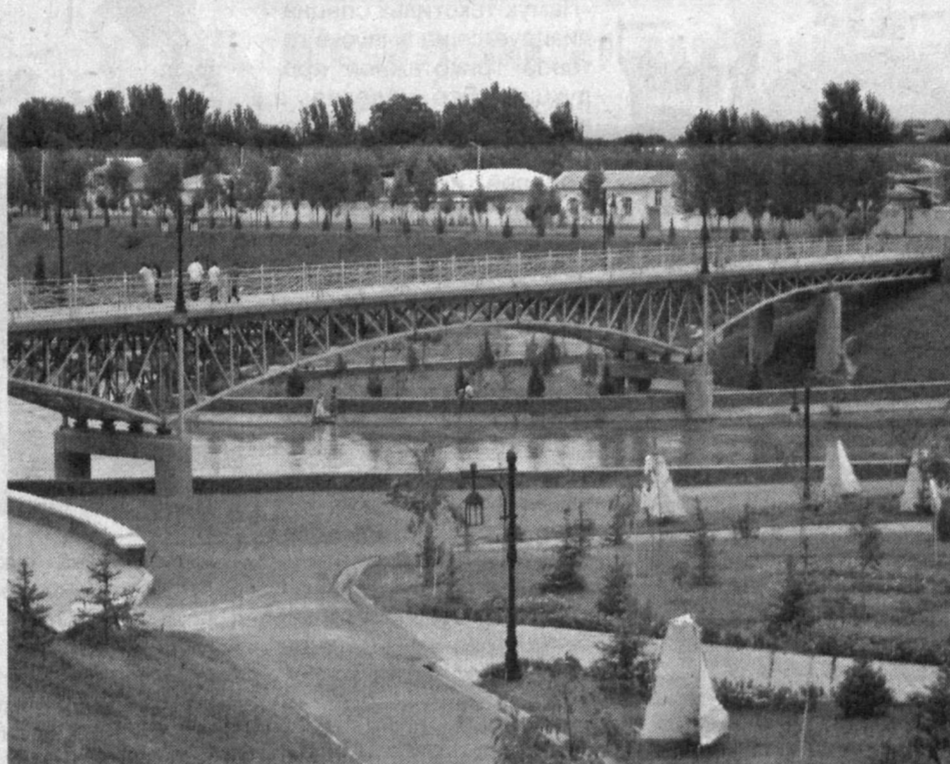
Наш город из года в год становится краше. Немаловажное значение в этом имеет не только обустройство дорог, строительство мостов, но и то, что в нем все большее внимание уделяется новым посадкам деревьев и кустарников, созданию зеленых уголков.