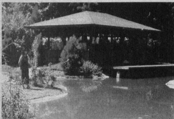
С наступлением осени парки и скверы столицы остаются излюбленным местом отдыха горожан.