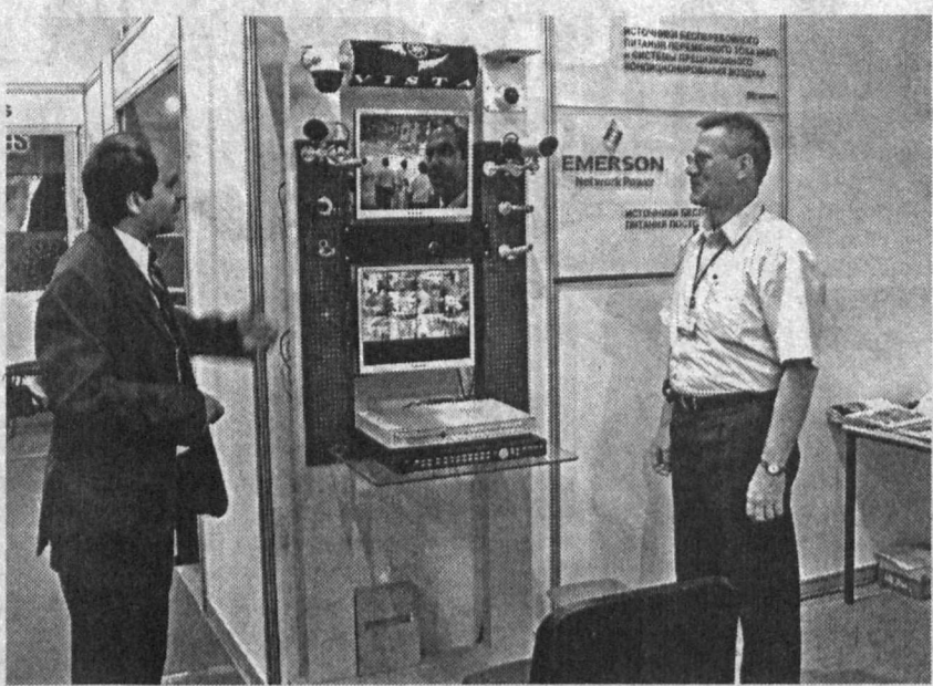
К. ОЛЬГИНА. НА СНИМКАХ: на выставке.