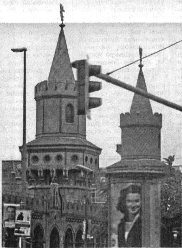
Широкие возможности для знакомства с культурой стран мира предоставляет туризм.