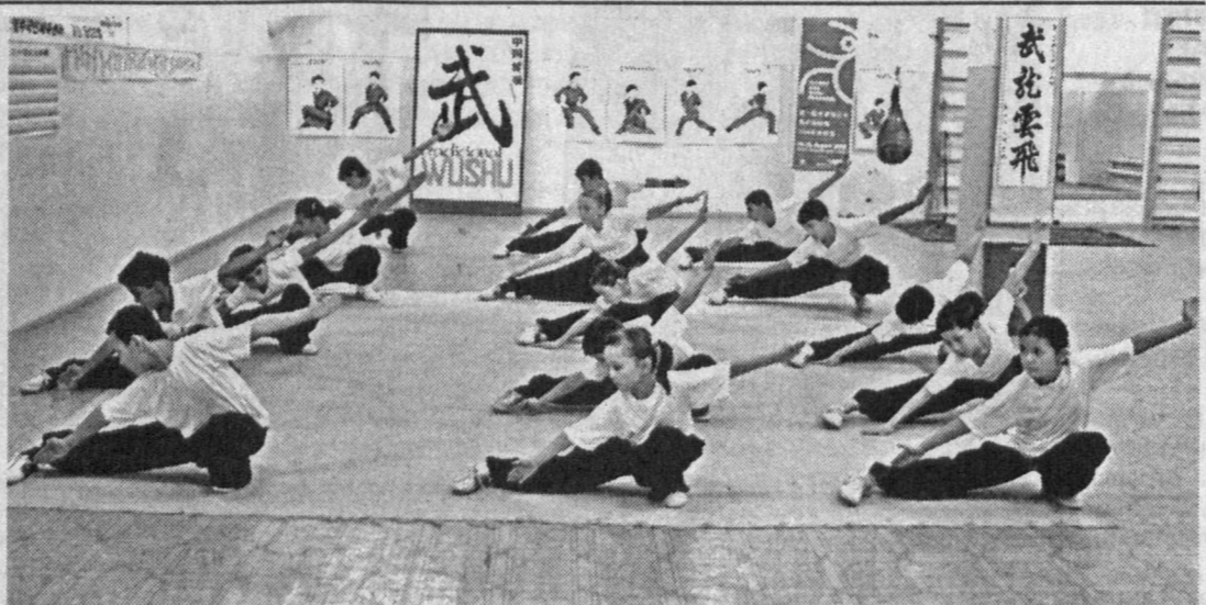
Вырасти смелыми, ловкими мечтают все мальчики и девочки. Именно поэтому и начинают заниматься ушу.