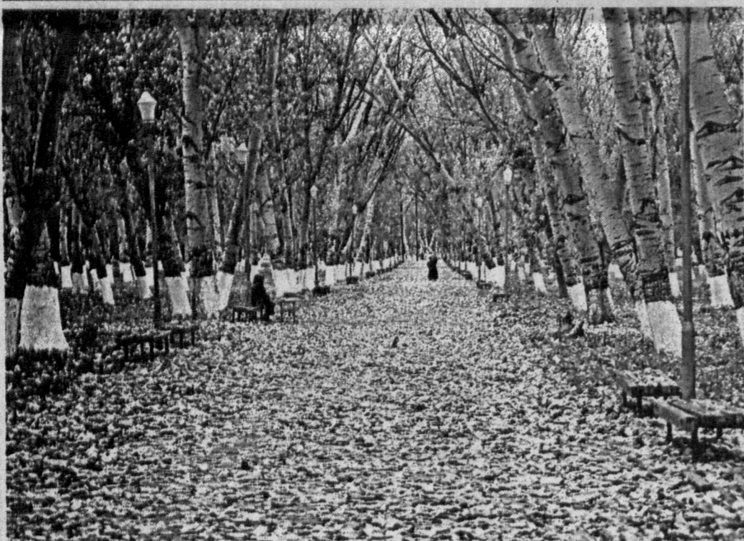
Осень, осень. Опять бушует листопад...