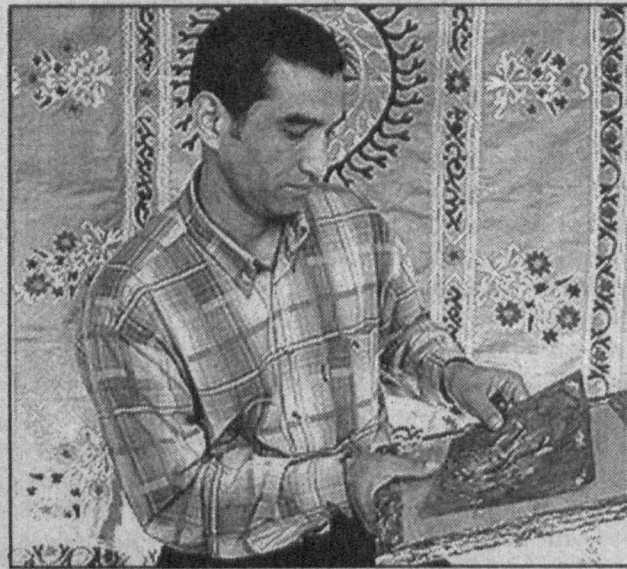
сказкой эпохи Мавераннахра.