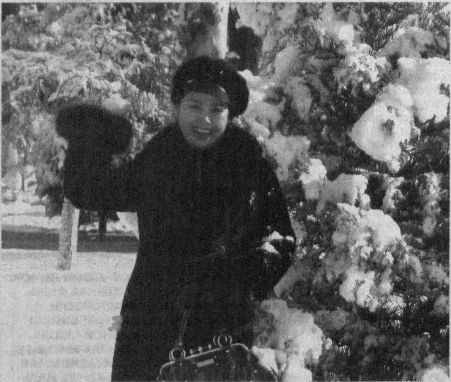
Зимушка-зима: и снег, и смех.