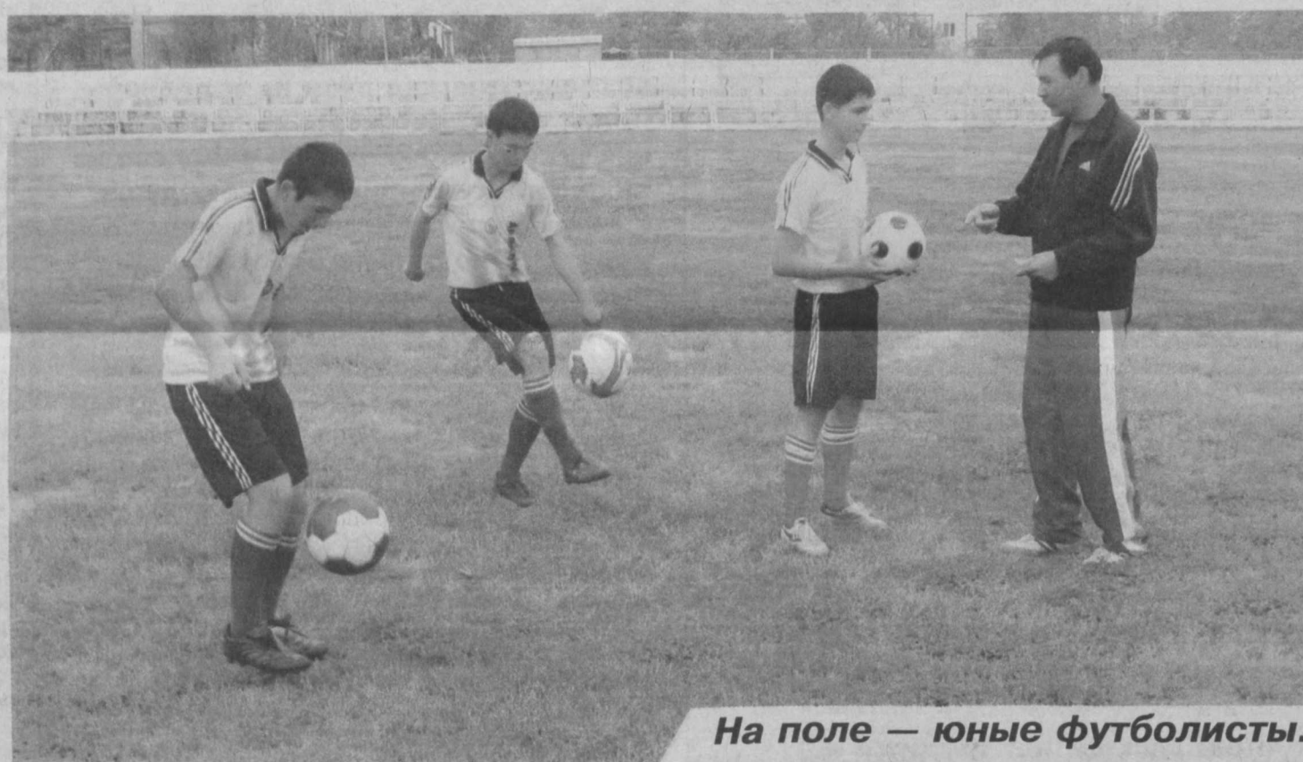
На поле – юные футболисты.