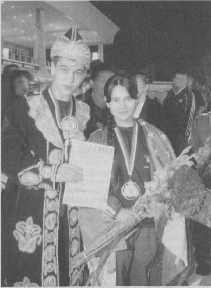
На спортивных аренах